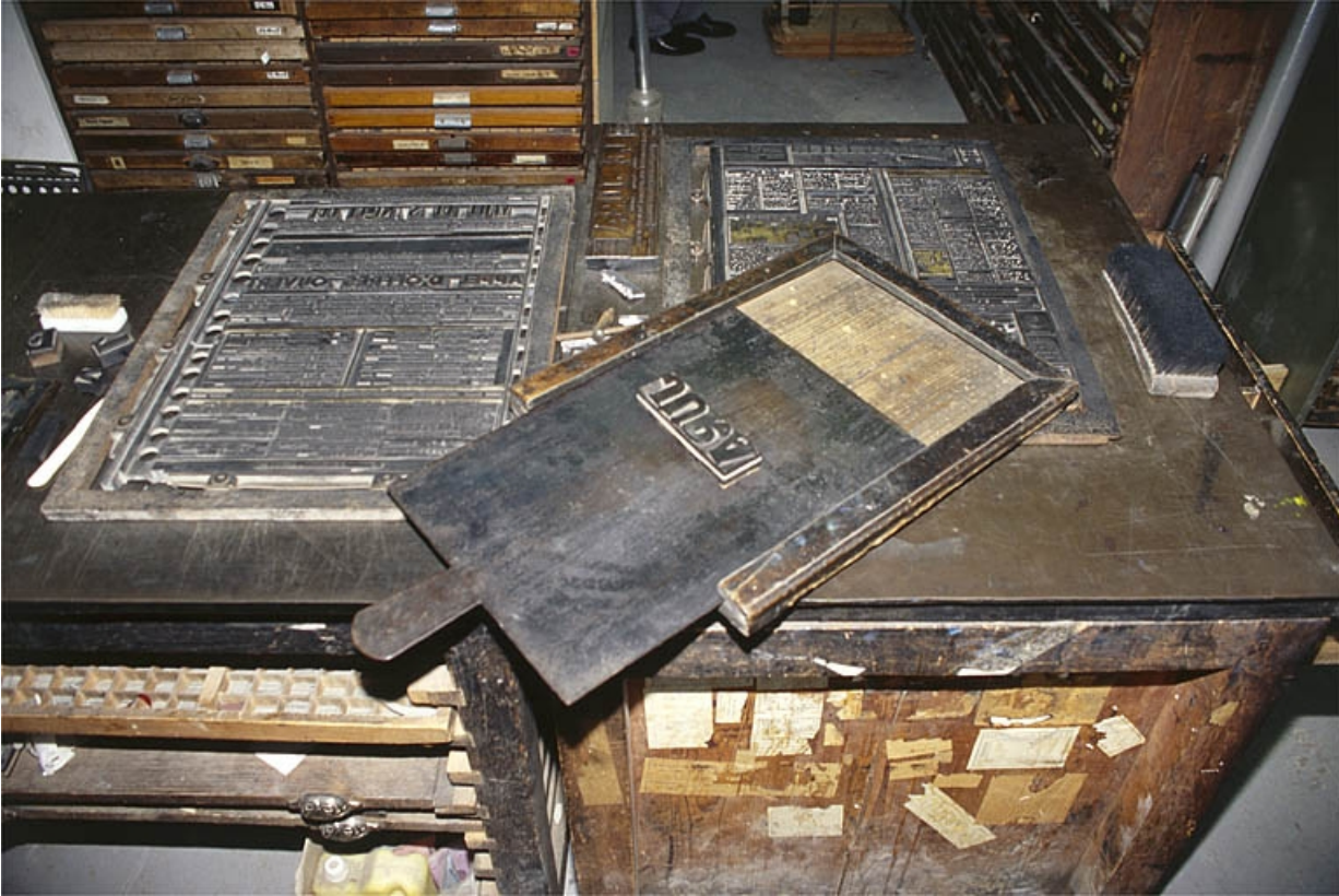
Galée en acier, posée sur un marbre.