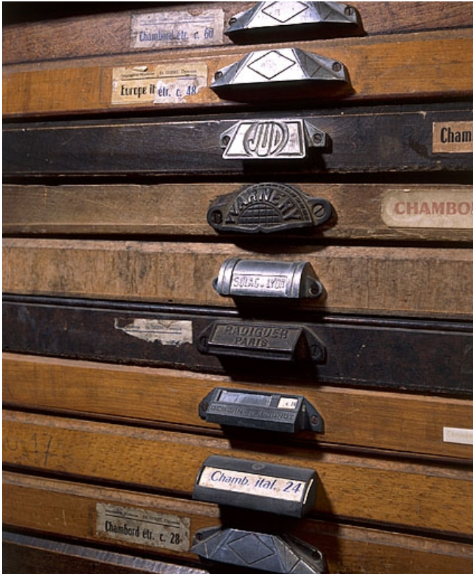
Marques de fabricants sur les poignées des casses.