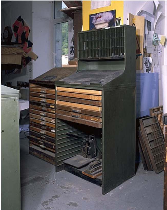
Rang à pupitre et interlignier. Ici composé d'une tôle formant un plan de travail incliné, le pupitre est en place. 39, Saint-Claude, 12 rue de la Poyat