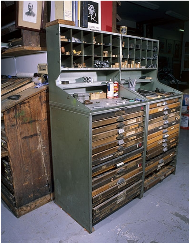
Deux rangs à pupitre et lingotiers. Ici composé d'une tôle formant un plan de travail incliné, le pupitre a été ôté. 39, Saint-Claude, 12 rue de la Poyat