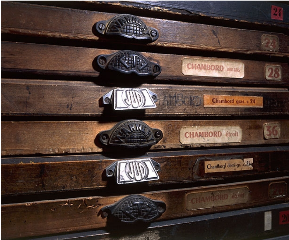
Marques de fabricants sur les poignées des casses.