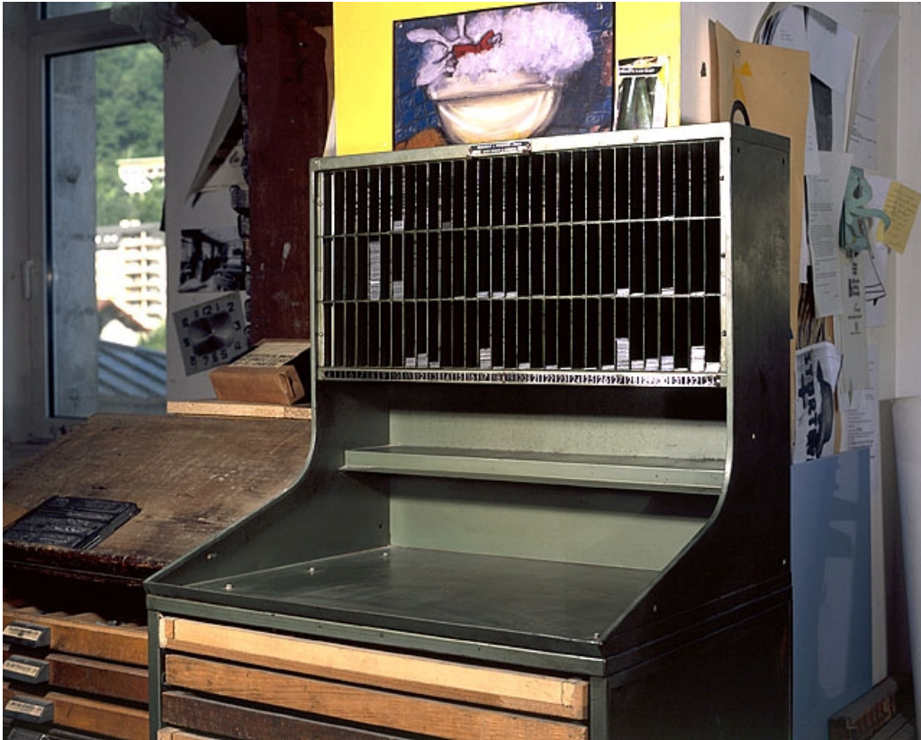
Partie supérieure du rang à pupitre et interlignier. Ici composé d'une tôle formant un plan de travail incliné, le pupitre a été ôté. 39, Saint-Claude, 12 rue de la Poyat