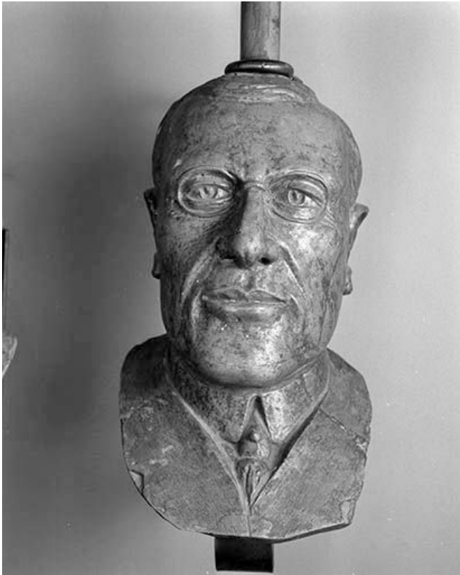
Thomas Woodrow Wilson.