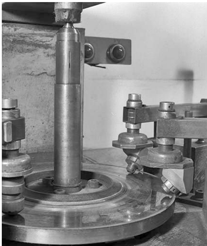
Tête des pinces mécaniques (tenailles de lapidaire) et meule. 39, Saint-Claude