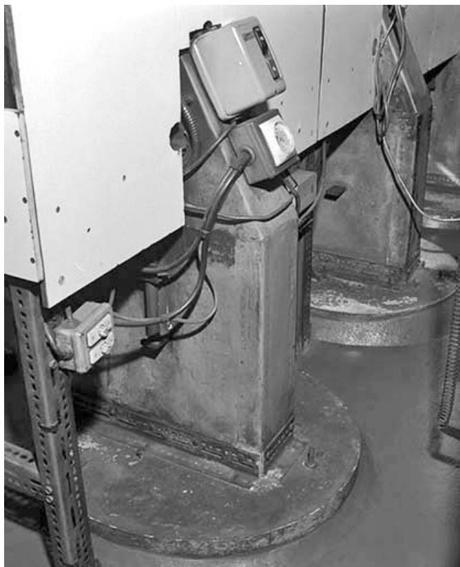
Support en béton d'une place.