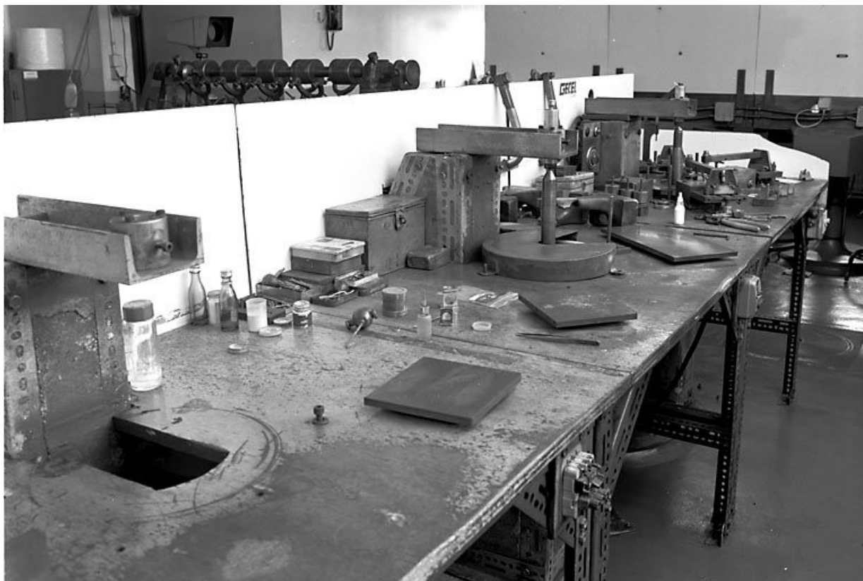
Vue d'ensemble. 39, Saint-Claude