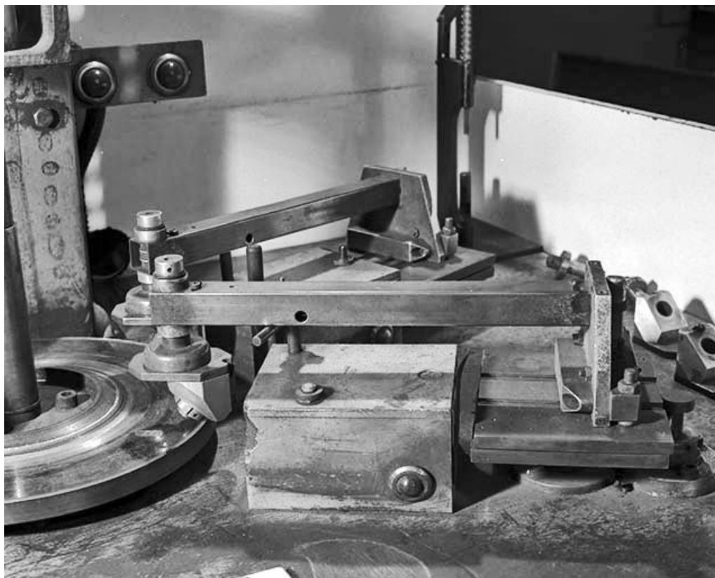
Pince mécanique (tenaille de lapidaire). La pince repose sur un boîtier qui va l'animer d'un mouvement de va-et-vient. 39, Saint-Claude