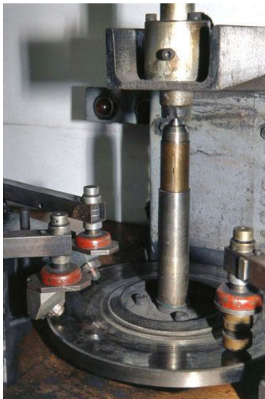
Tête des pinces mécaniques (tenailles de lapidaire) et meule. 39, Saint-Claude