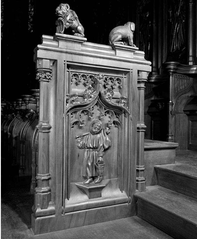
Troisième jouée basse : moine jardinier.