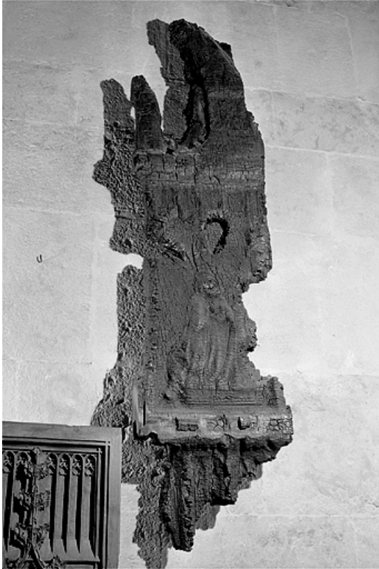
Première jouée haute : Vierge de l'Annonciation, brûlée.