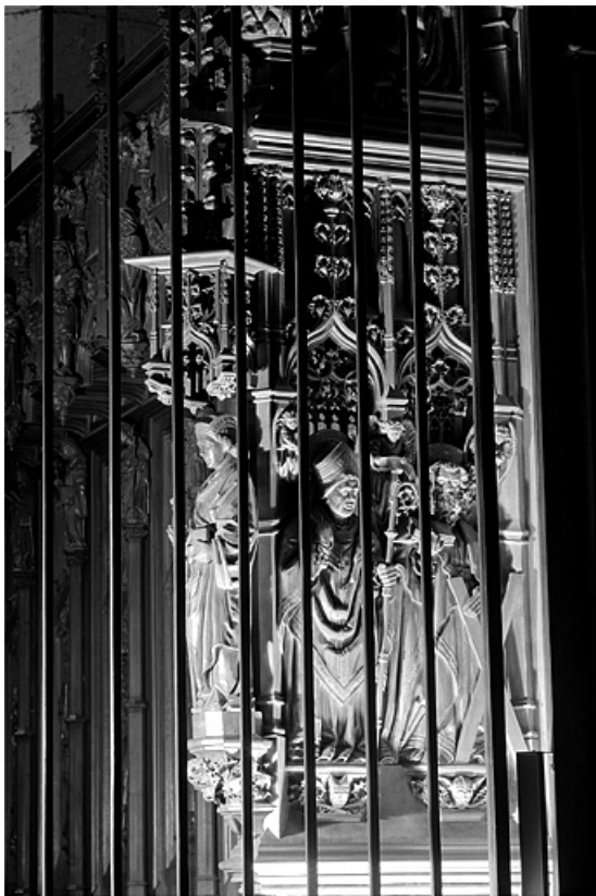
Première jouée haute : saint Claude et saint André.