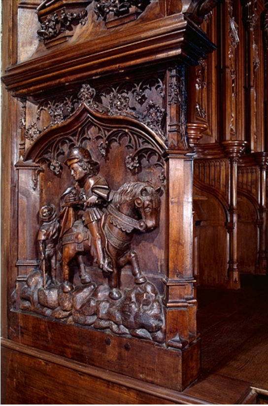
Deuxième jouée haute : La Charité de saint Martin.