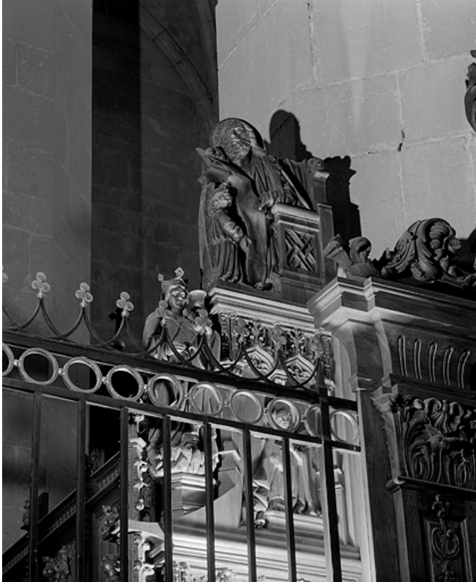
Première jouée haute : Vierge de l'Annonciation et saint Matthieu. 39, Saint-Claude place de l' Abbaye