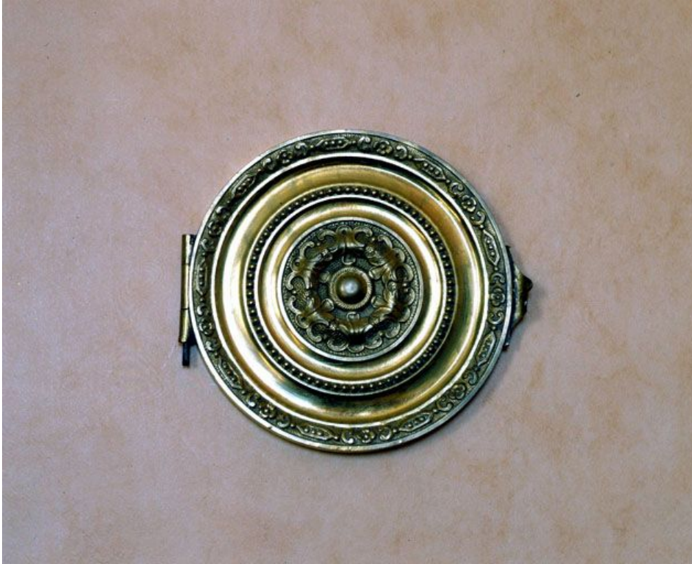
Bouche de chaleur de la cheminée, fermée.

39, Saint-Claude, 2 rue de la Sous-préfecture