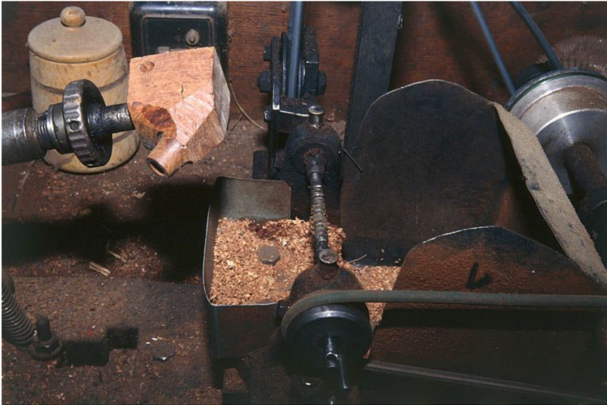
Partie gauche : détail du support de l'ébauchon. A droite, arbre cranté horizontal faisant office de fraise. 39, Saint-Claude, lieudit : Etables