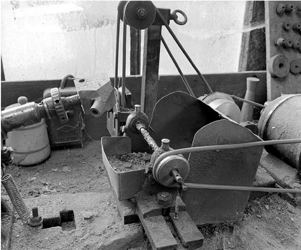
Vue d'ensemble de la partie droite : arbre cranté horizontal faisant office de fraise.