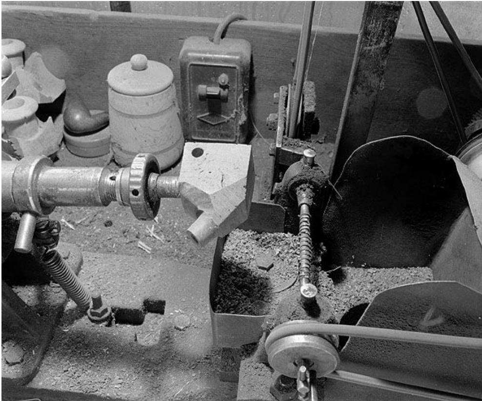
Partie gauche : détail du support de l'ébauchon. A droite, arbre cranté horizontal faisant office de fraise. 39, Saint-Claude, lieudit : Etables