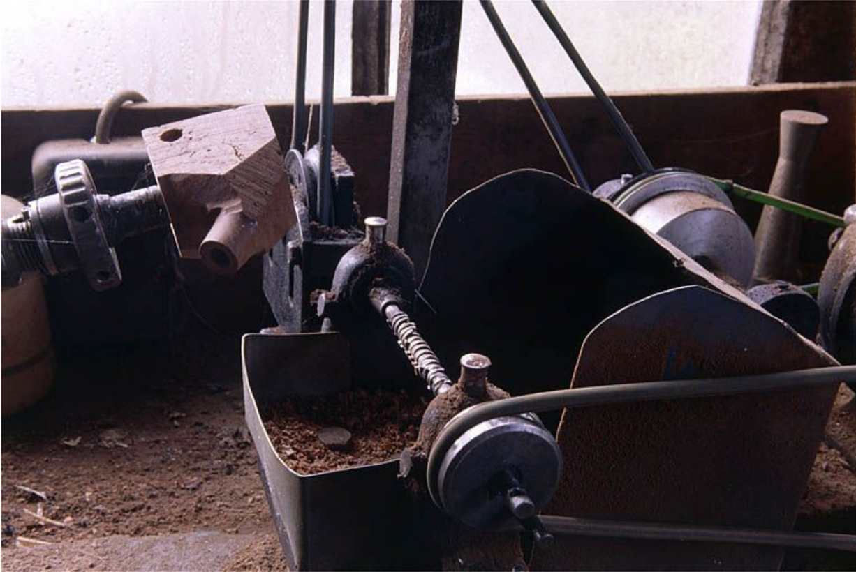
Vue d'ensemble de la partie droite : arbre cranté horizontal faisant office de fraise.