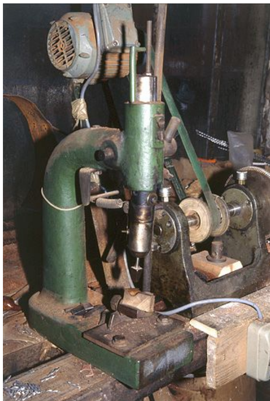
Vue d'ensemble rapprochée.