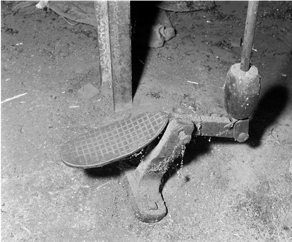
Détail de la pédale.