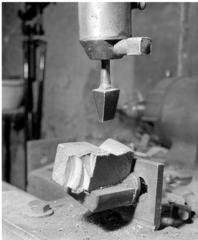
Détail du poinçon et du support de pipe.