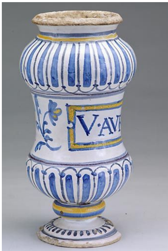
Vue de côté.

39, Saint-Claude, 2 montée de l' Hôpital