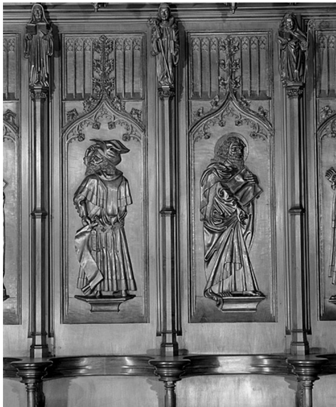
Les cinquième et sixième panneaux.