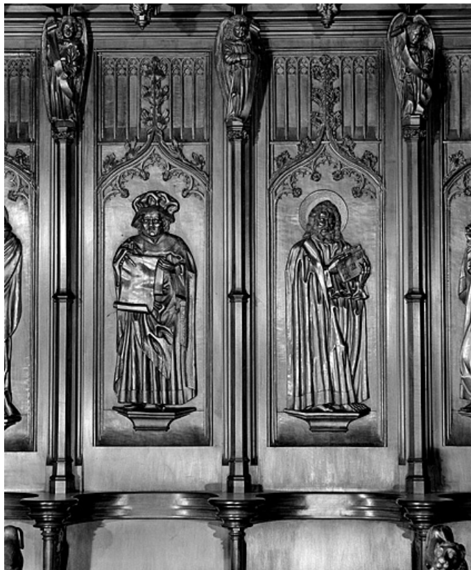
Les onzième et douzième panneaux.