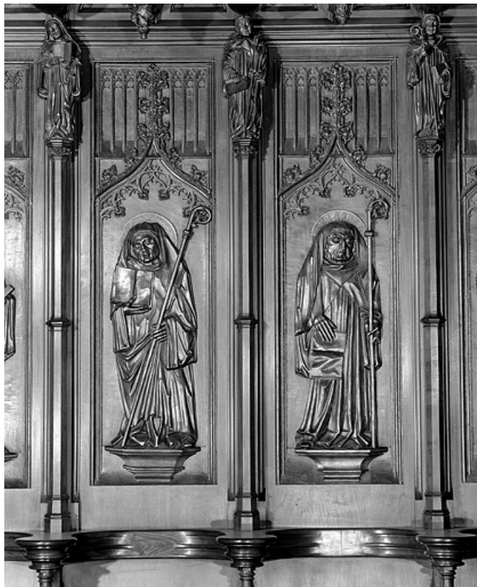
Les dix-septième et dix-huitième panneaux.