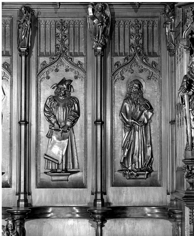
Les premier et deuxième panneaux.