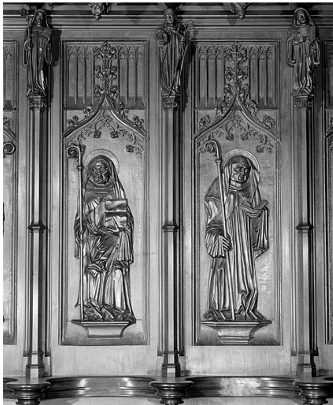
Les dix-neuvième et vingtième panneaux.