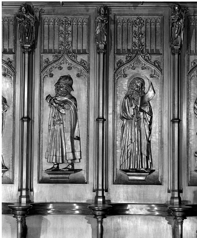
Les troisième et quatrième panneaux.