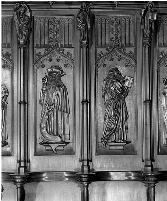
Les neuvième et dixième panneaux.