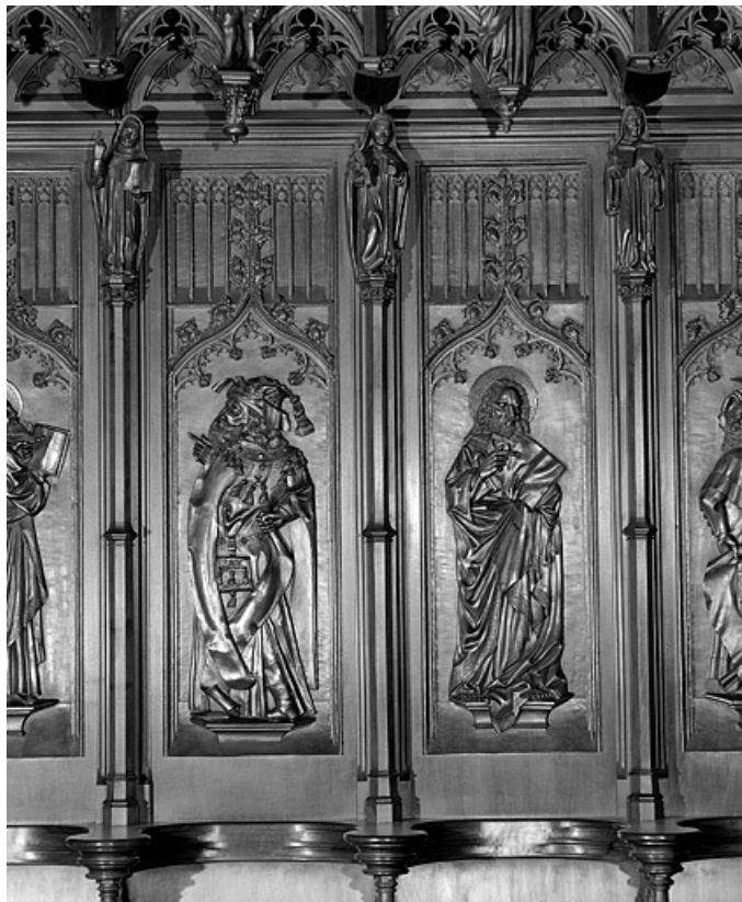
Les septième et huitième panneaux.