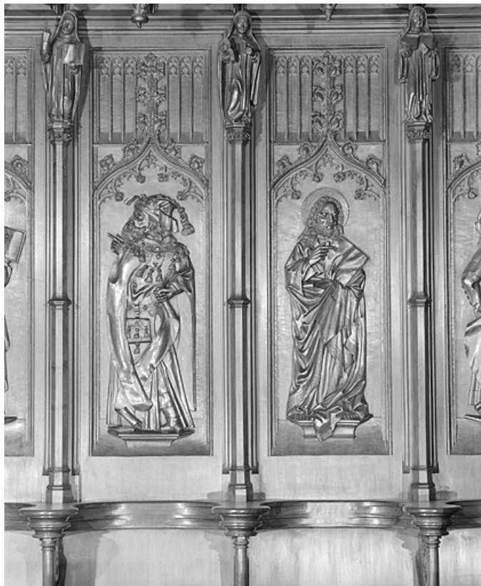
Les septième et huitième panneaux.