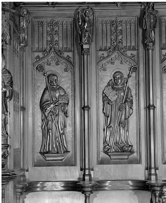
Les vingt et unième et vingt-deuxième panneaux.