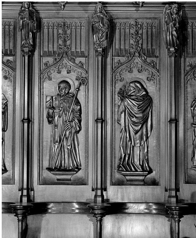
Les treizième et quatorzième panneaux.