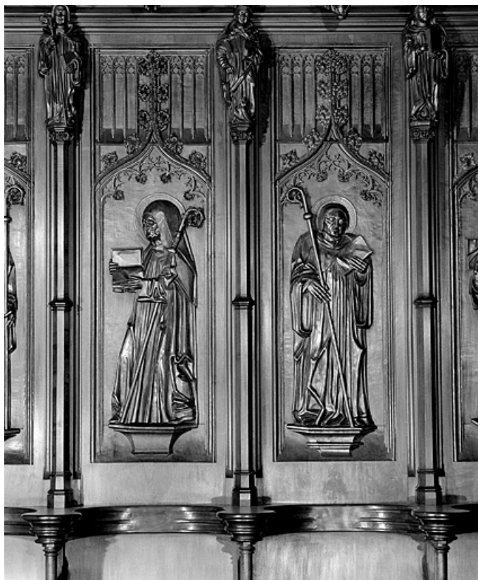
Les quinzième et seizième panneaux.