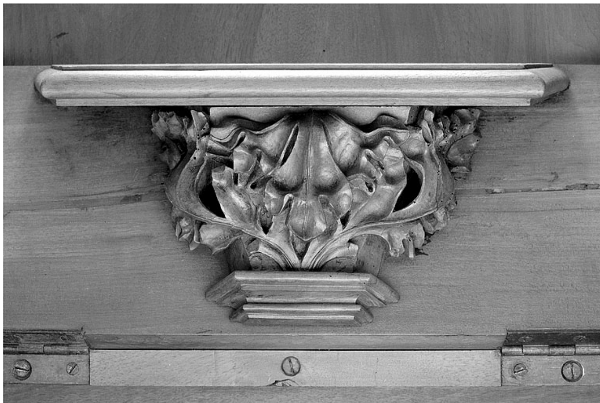
Miséricorde de la huitième stalle basse.