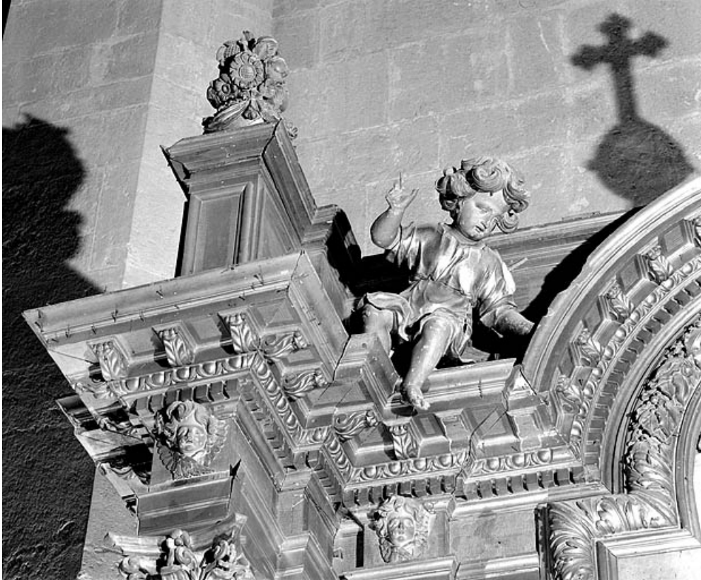
Détail de la partie supérieure gauche.