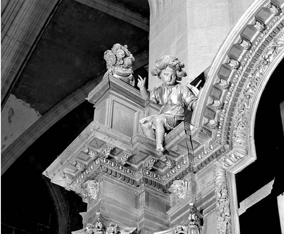
Détail de la partie supérieure gauche.