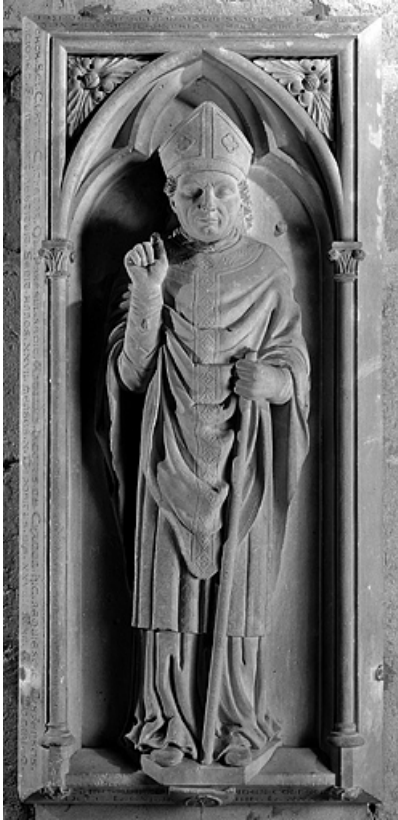
Vue générale, de face.