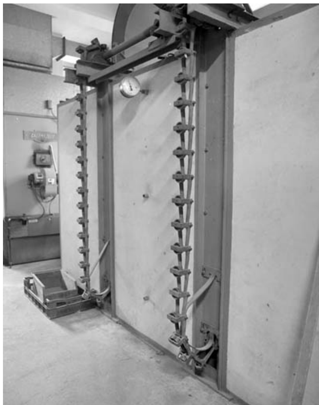
Détail de la crémaillère.