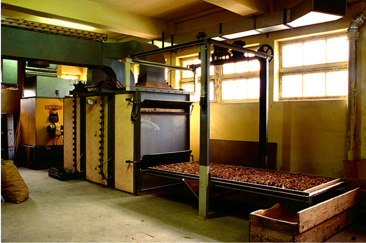
De gauche à droite : chaudière, séchoir et grille chargée de cônes sur le portique. 39, Supt, lieudit : la Joux