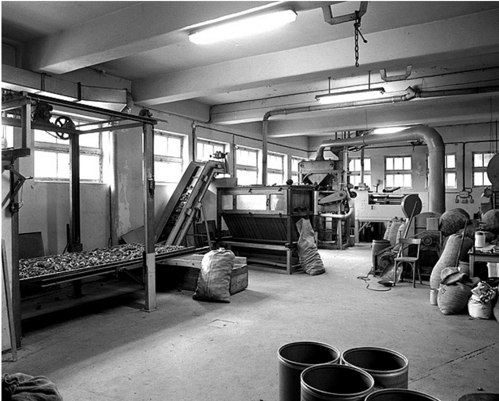
Intérieur de l'atelier de la Sécherie de graines de résineux.