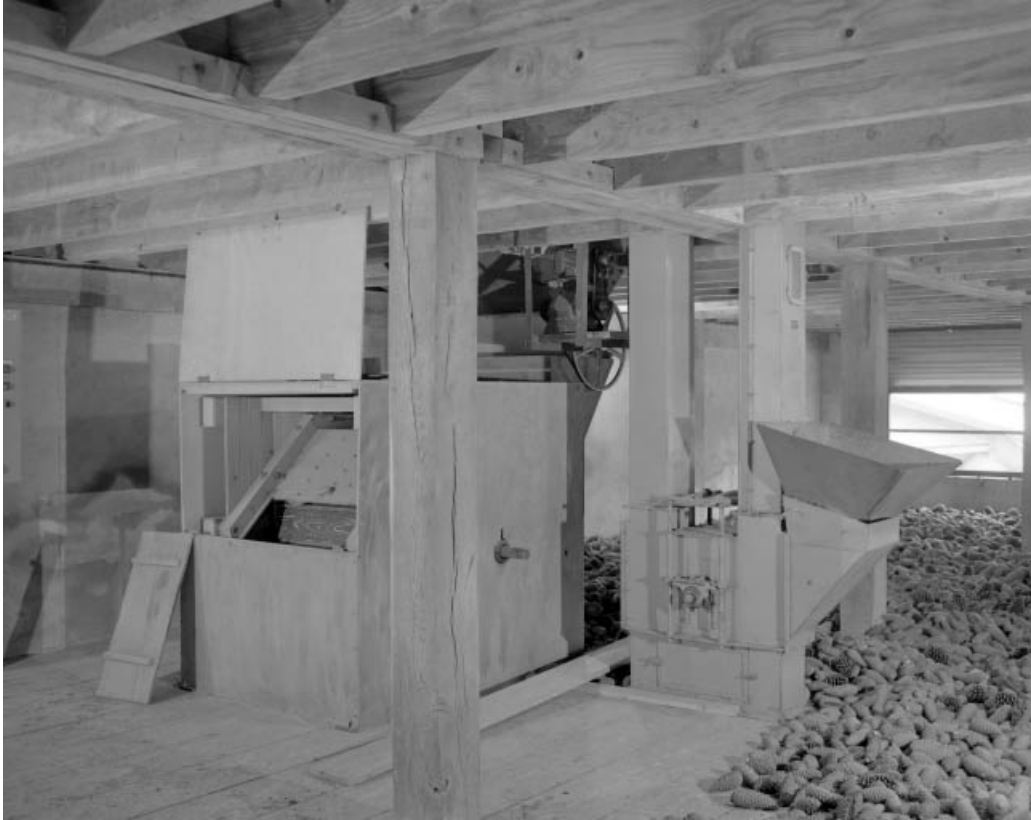
Vue d'ensemble. Batteur et élévateur à godets.