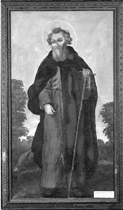
Saint Antoine abbé.

39, Saint-Claude chemin de la Chapelle, lieudit : Chaumont