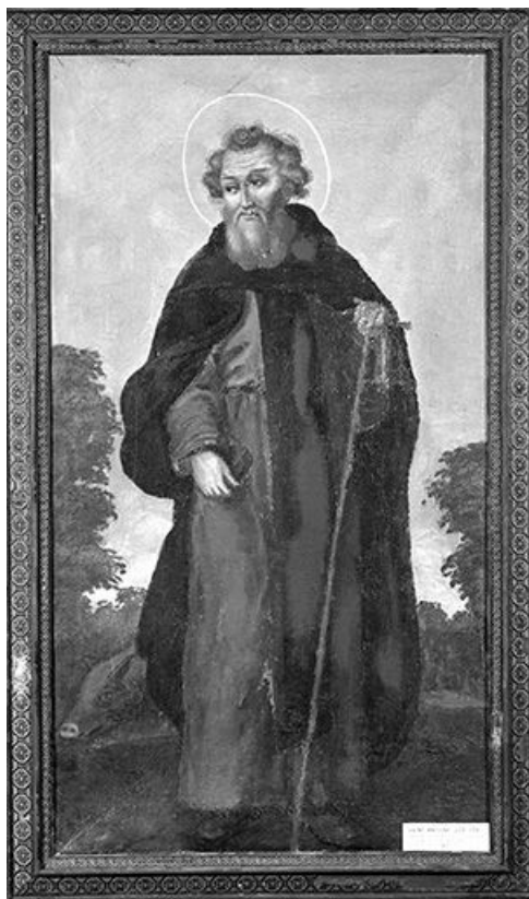
Saint Antoine abbé.

39, Saint-Claude chemin de la Chapelle, lieudit : Chaumont