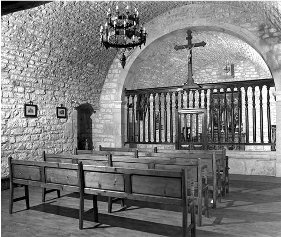
Le chœur et la nef vus depuis l'angle sud-ouest.

39, Saint-Claude chemin de la Chapelle, lieudit : Chaumont