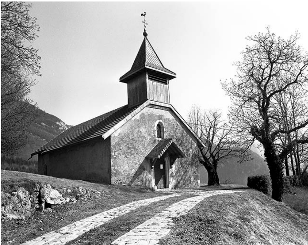
Façade ouest vue de trois quarts.

39, Saint-Claude chemin de la Chapelle, lieudit : Chaumont