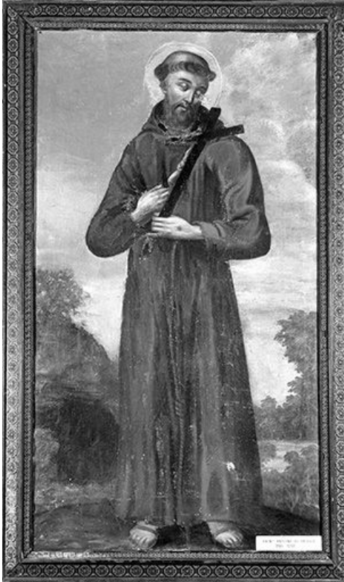
Saint Antoine de Padoue.

39, Saint-Claude chemin de la Chapelle, lieudit : Chaumont