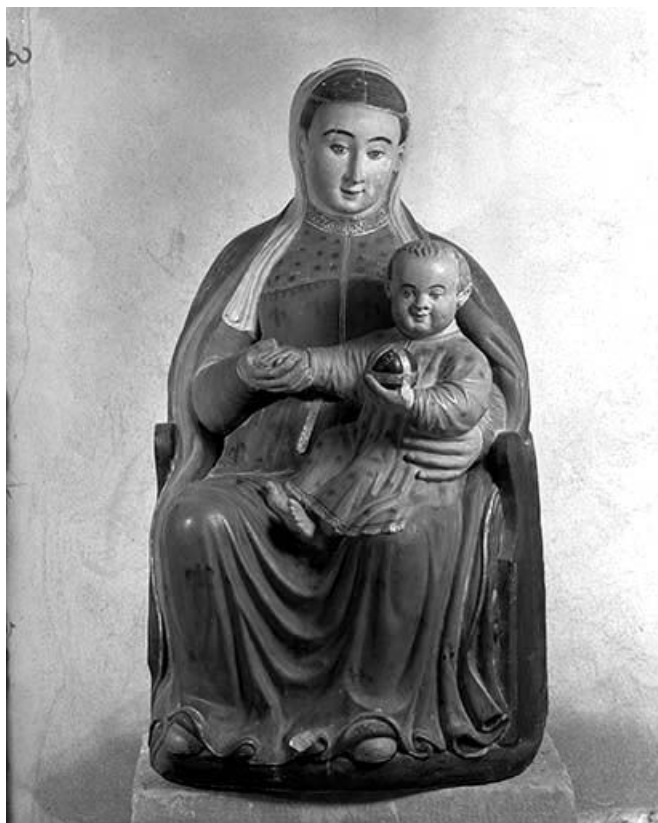
Vue de face.

39, Saint-Claude chemin de la Chapelle, lieudit : Chaumont