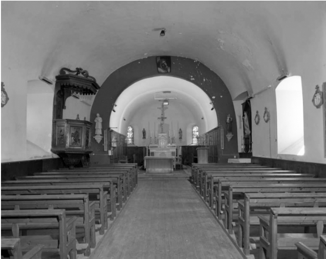
La nef et le chœur vus depuis l'entrée.

39, Saint-Claude rue de l' Eglise, lieudit : Cinquétral