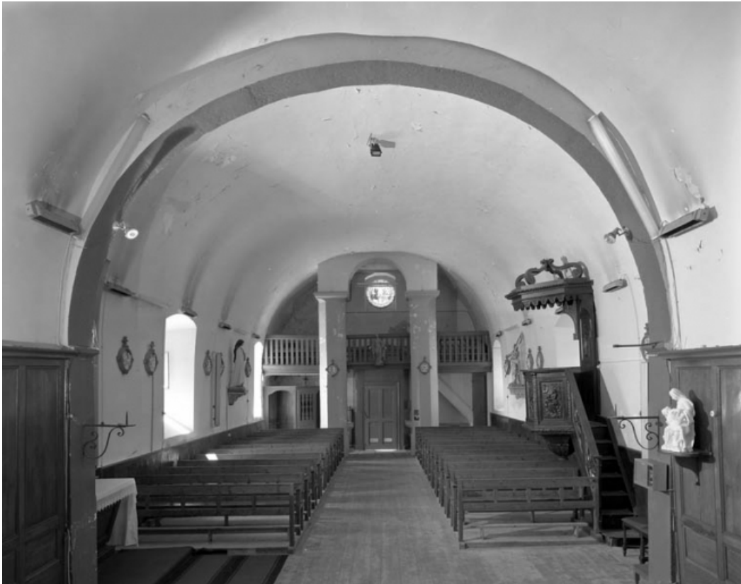
La nef vue depuis le chœur.

39, Saint-Claude rue de l' Eglise, lieudit : Cinquétral