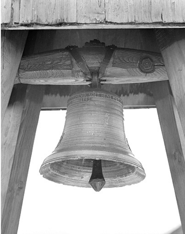
Vue depuis le nord-est. 39, Cultura