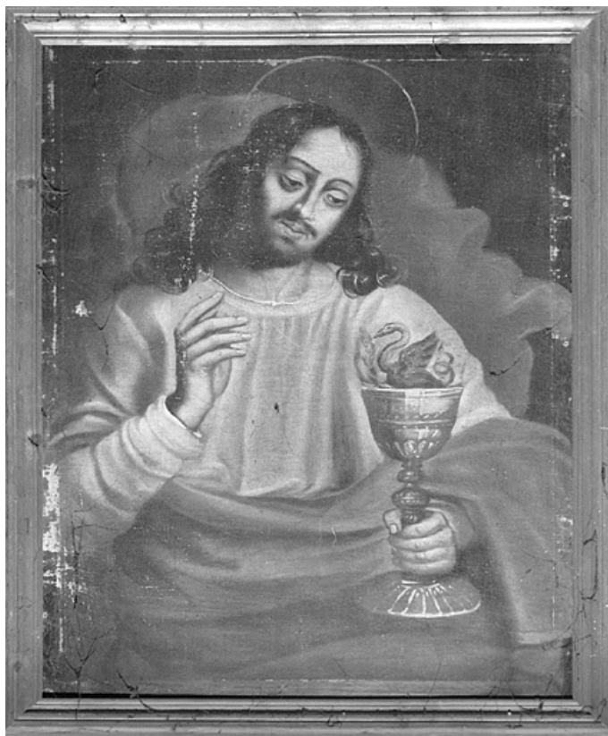
Saint Jean l'évangéliste.