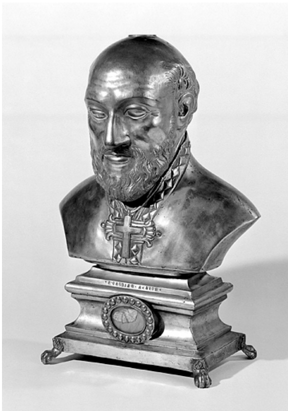
Vue générale de trois quarts.