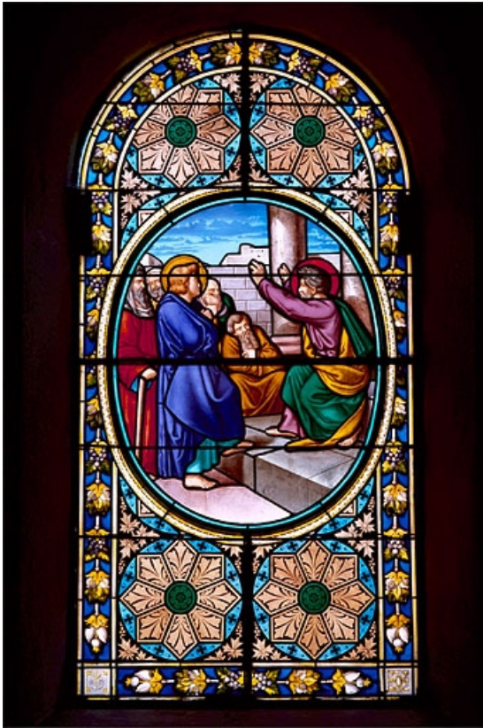
Baie 5 : Denis l'aréopagite écoute la prédication de saint Paul à Athènes. 39, Leschères