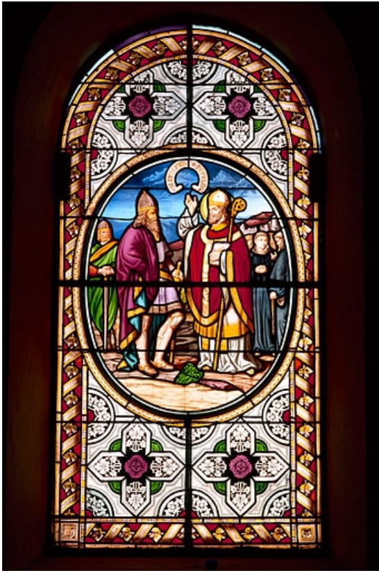
Baie 8 : saint Denis bénissant le roi Dagobert.