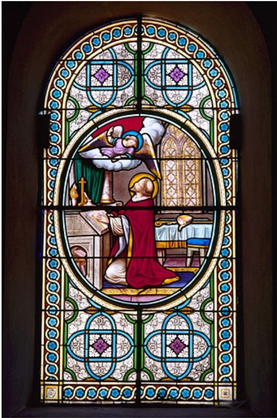
Baie 9 : saint Denis est visité par un ange.