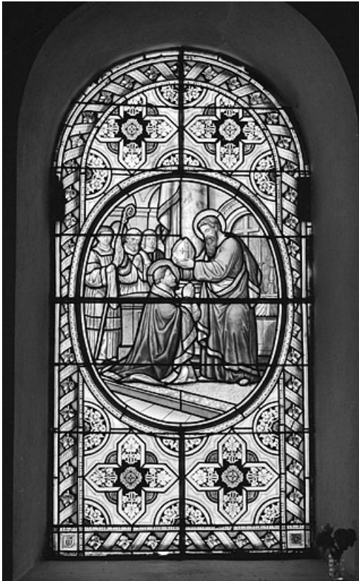
Baie 7 : saint Denis consacré évêque d'Athènes par saint Paul. 39, Leschères