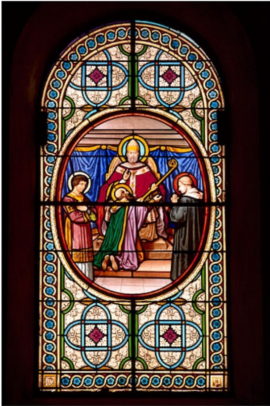
Baie 10 : saint Denis bénissant deux saints moines. 39, Leschères