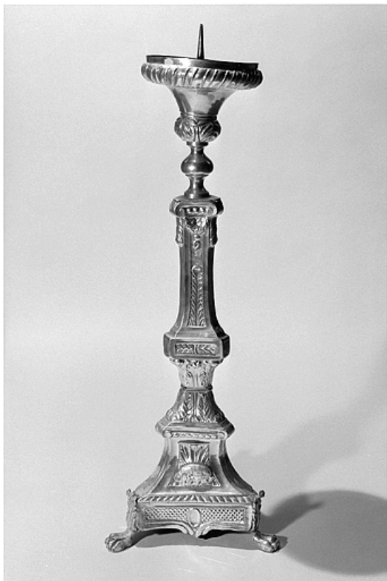
Vue du chandelier d'autel.