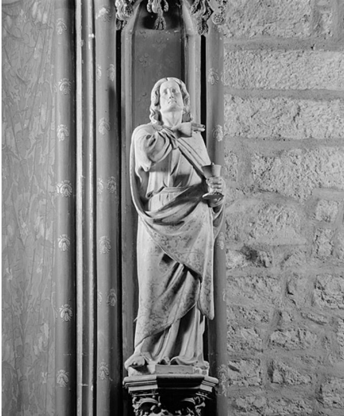
Saint Jean l'évangéliste.

39, Lons-le-Saunier, 1 rue de la Préfecture