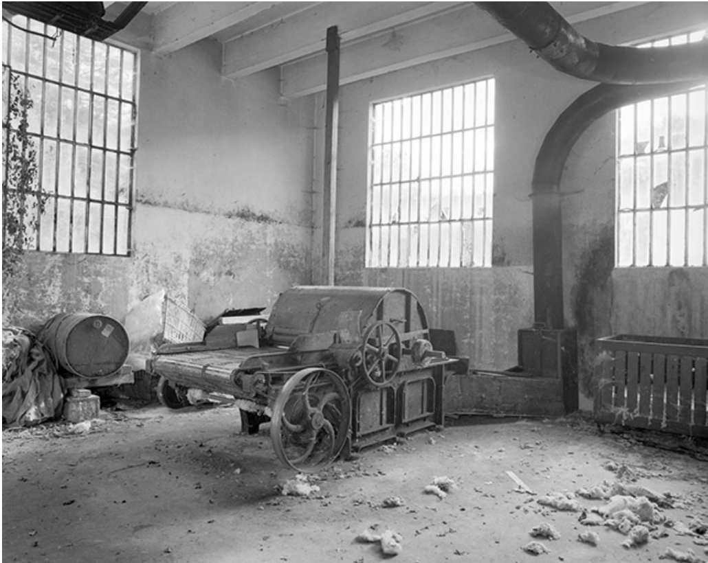
Face avant vue de trois quarts droite.