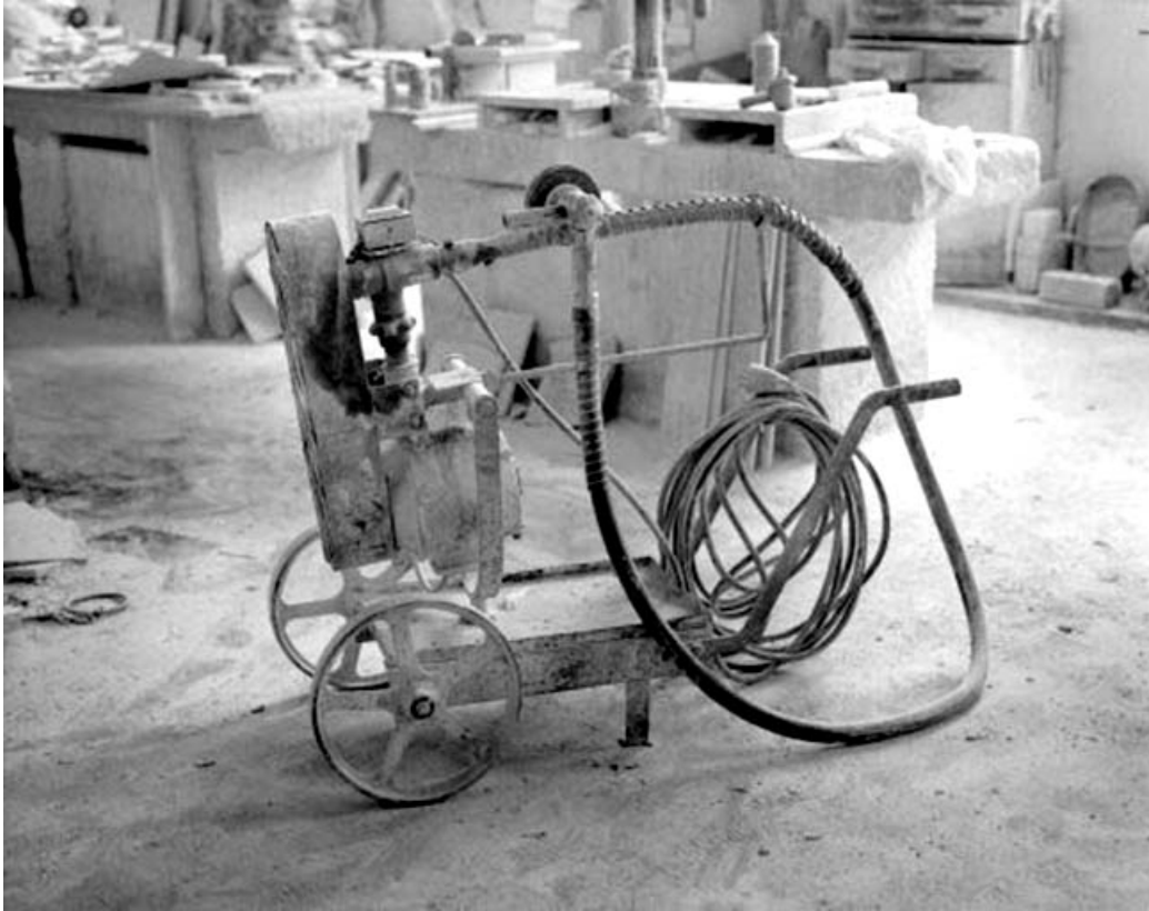
Vue de côté.

39, Saint-Amour, 2 à 6 rue de la Marbrerie