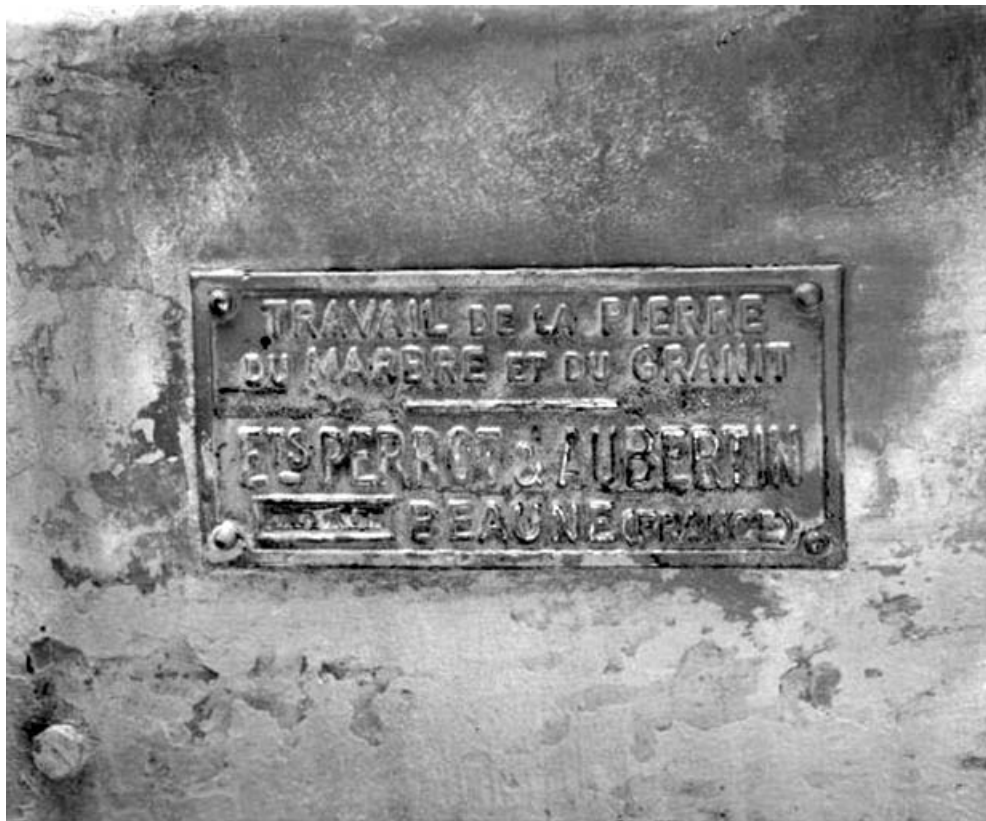
Débiteuse-moulreuse sud : plaque du constructeur.

39, Saint-Amour, 2 à 6 rue de la Marbrerie