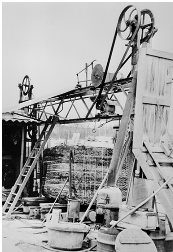
La scie à fil, en 1974.

39, Saint-Amour, 2 à 6 rue de la Marbrerie