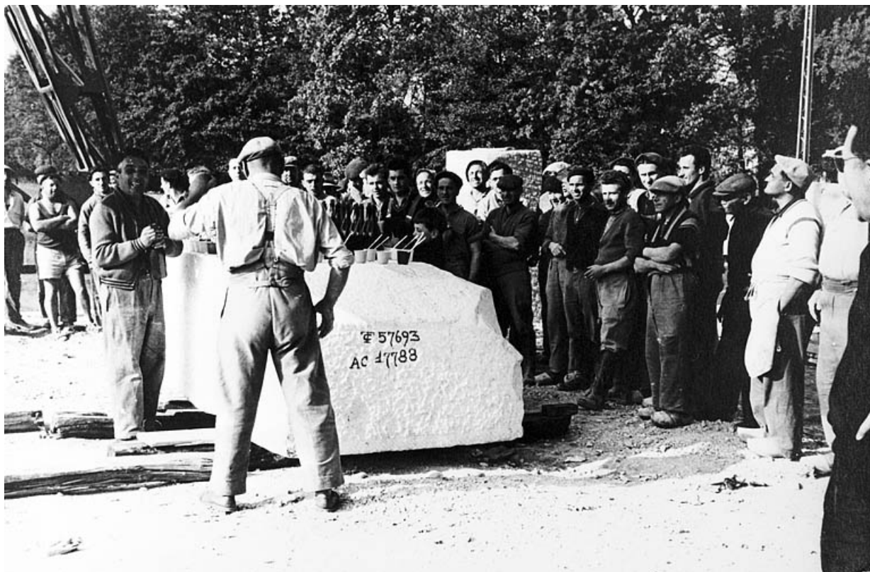
Personnel réuni le jour de l'inauguration.

39, Saint-Amour, 2 à 6 rue de la Marbrerie