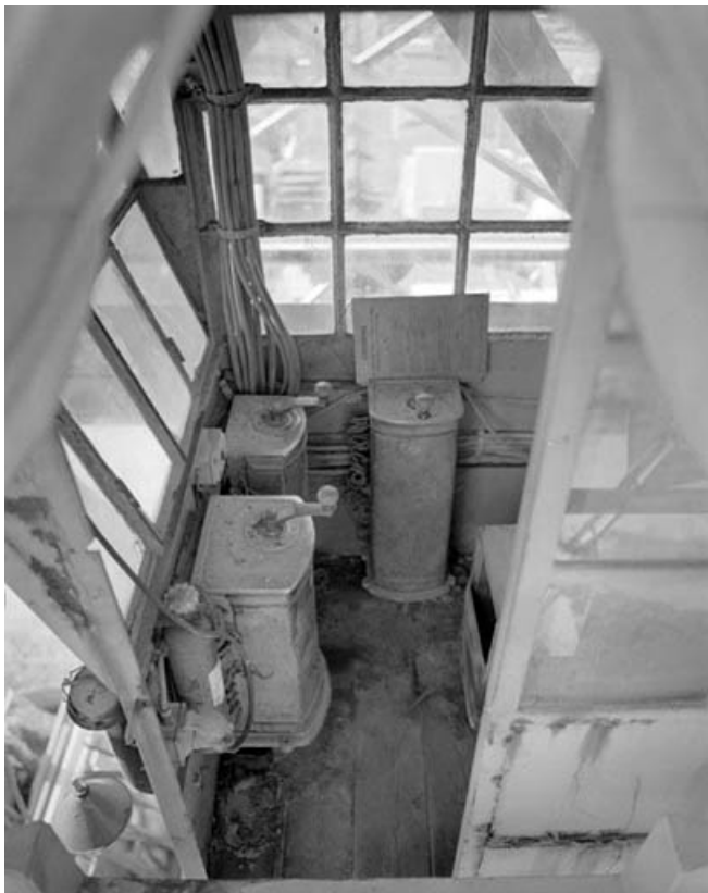
Intérieur de la cabine.

39, Saint-Amour, 2 à 6 rue de la Marbrerie