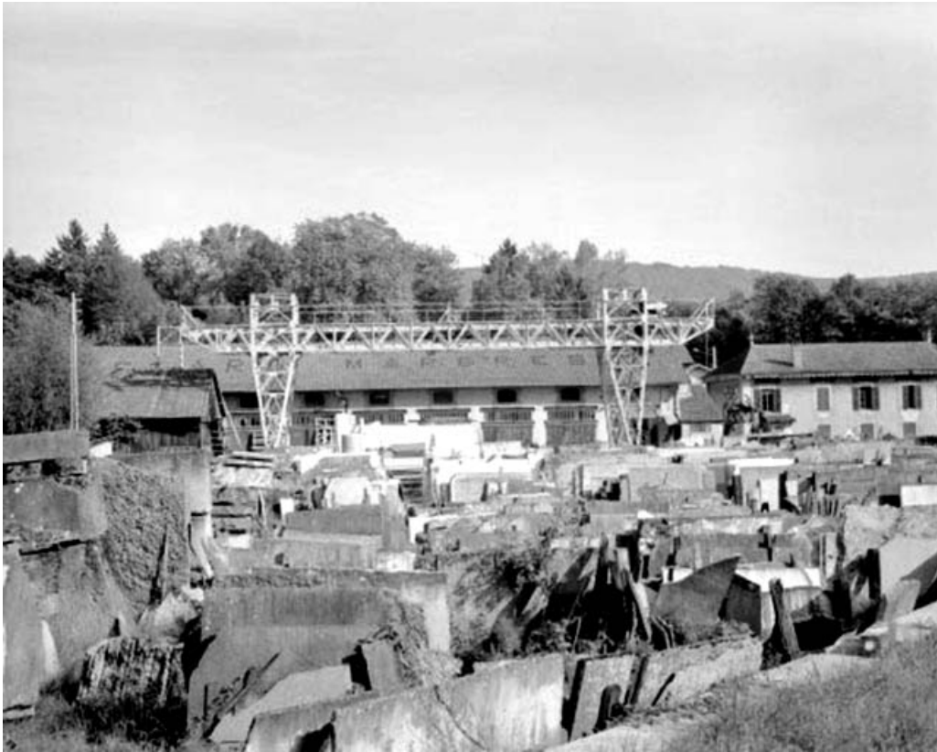
Portique roulant vu de face.

39, Saint-Amour, 2 à 6 rue de la Marbrerie