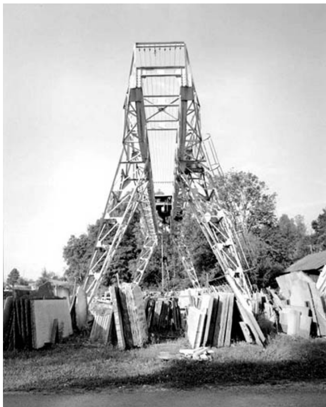
Vue de côté.

39, Saint-Amour, 2 à 6 rue de la Marbrerie