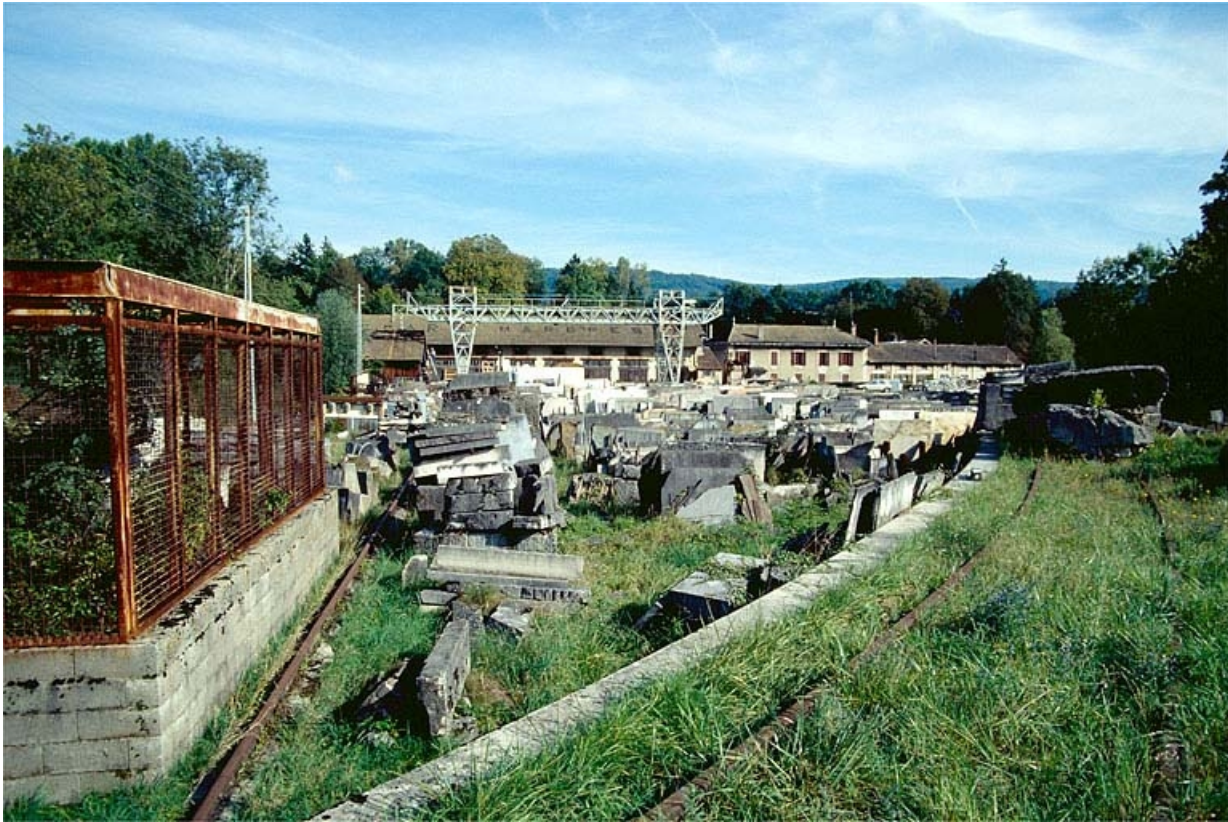
Vue d'ensemble de l'aire des matières premières et du portique roulant. Voie de roulement à gauche, voie ferrée à droite. 39, Saint-Amour, 2 à 6 rue de la Marbrerie