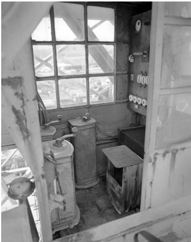
Intérieur de la cabine.

39, Saint-Amour, 2 à 6 rue de la Marbrerie