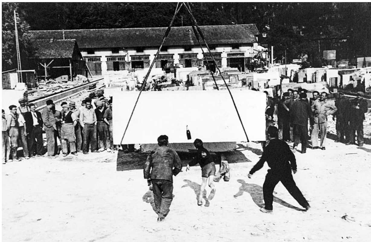
Inauguration : baptême du portique roulant.

39, Saint-Amour, 2 à 6 rue de la Marbrerie