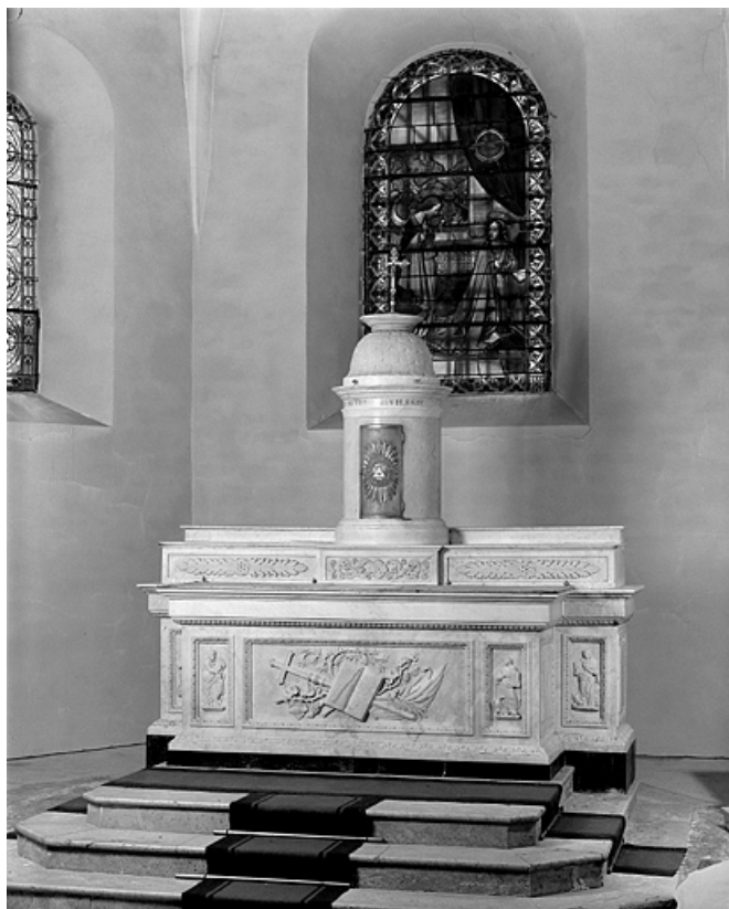
Vue d'ensemble. 39, Les Bouchoux