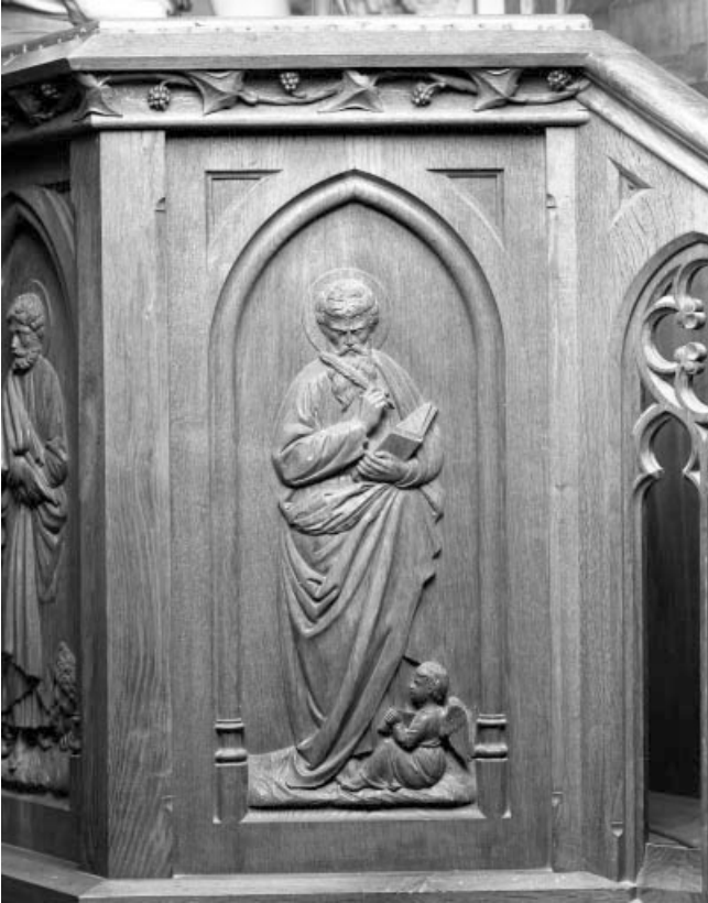
Quatrième panneau de la cuve : saint Matthieu.