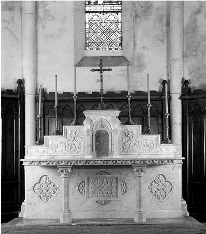
Le maître-autel et son tabernacle : vue générale.