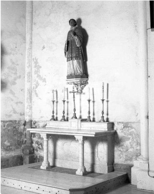
L'autel latéral nord.