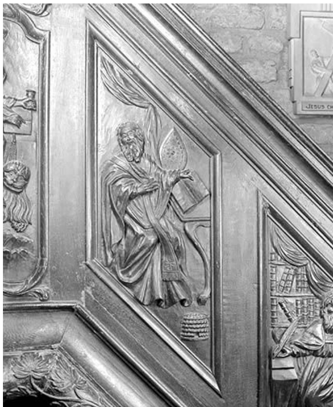
Troisième panneau de la rampe : saint Ambroise.