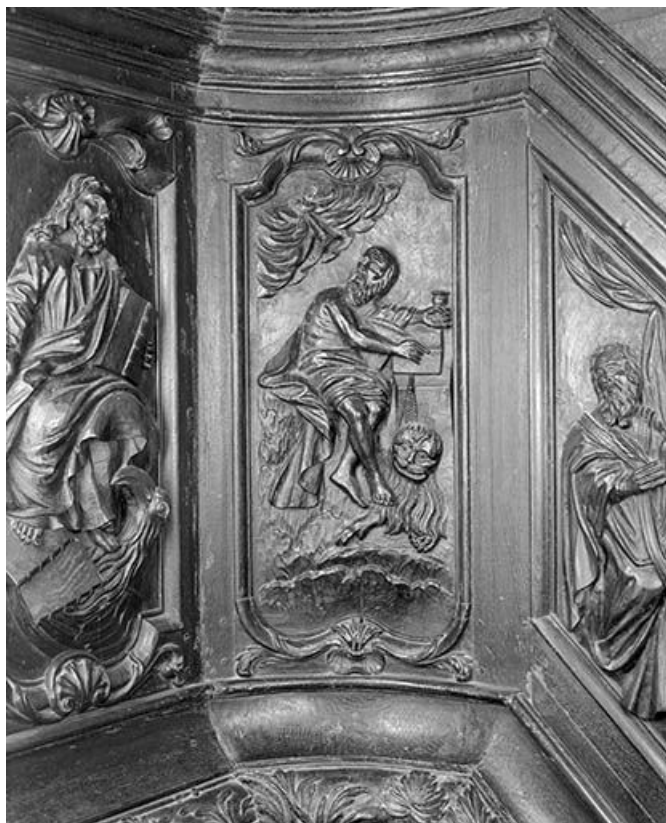
Quatrième panneau de la rampe : saint Jérôme. 39, Macornay