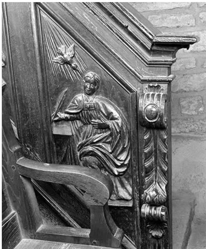
Premier panneau de la rampe : saint Grégoire. 39, Macornay