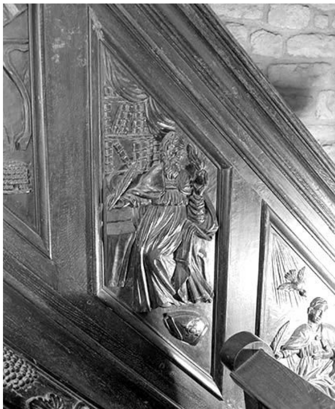
Deuxième panneau de la rampe : saint Augustin. 39, Macornay