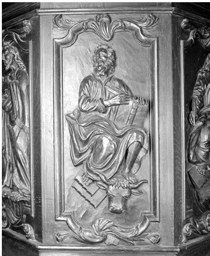
Quatrième panneau de la cuve : saint Luc.