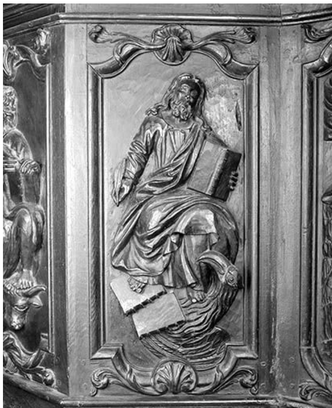
Cinquième panneau de la cuve : saint Jean. 39, Macornay