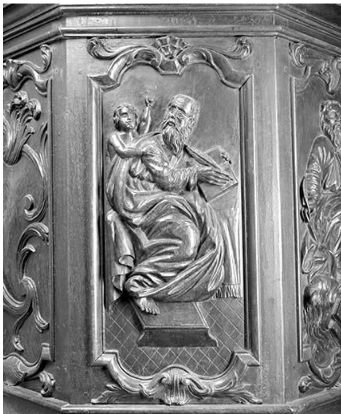
Premier panneau de la cuve : saint Matthieu. 39, Macornay