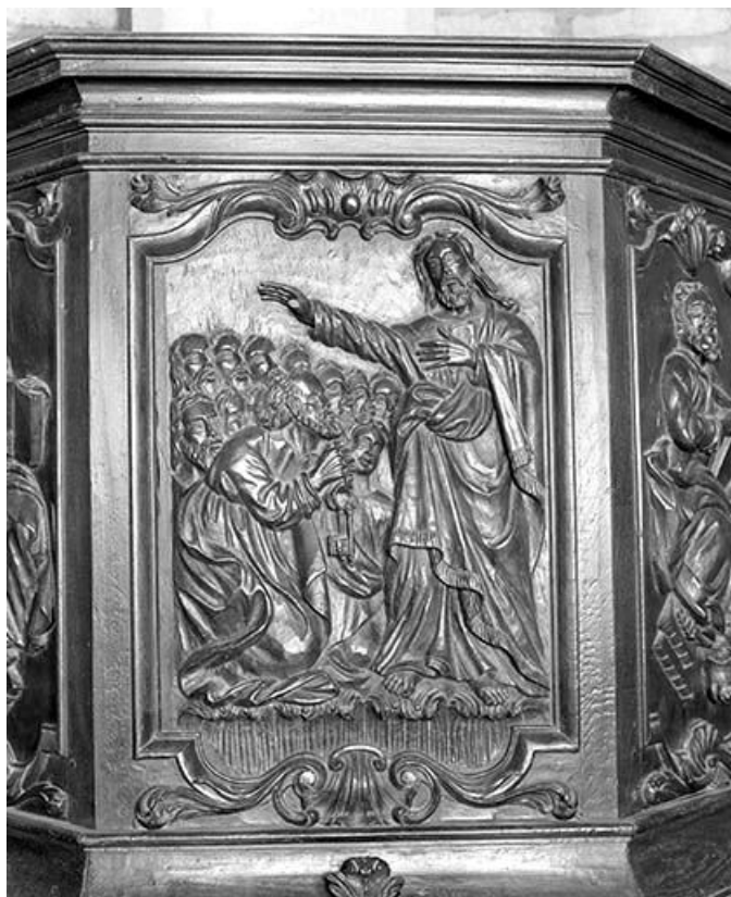
Troisième panneau de la cuve : la Mission des Apôtres.