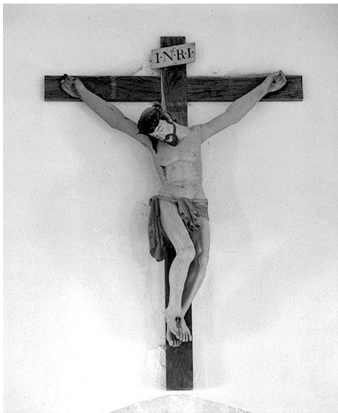
Vue générale. 39, Courlaoux