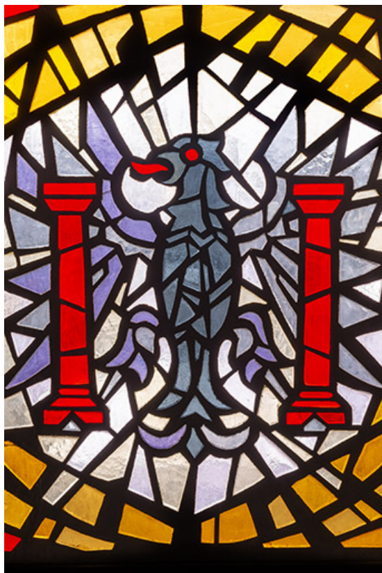
Détail : armoiries de Besançon.