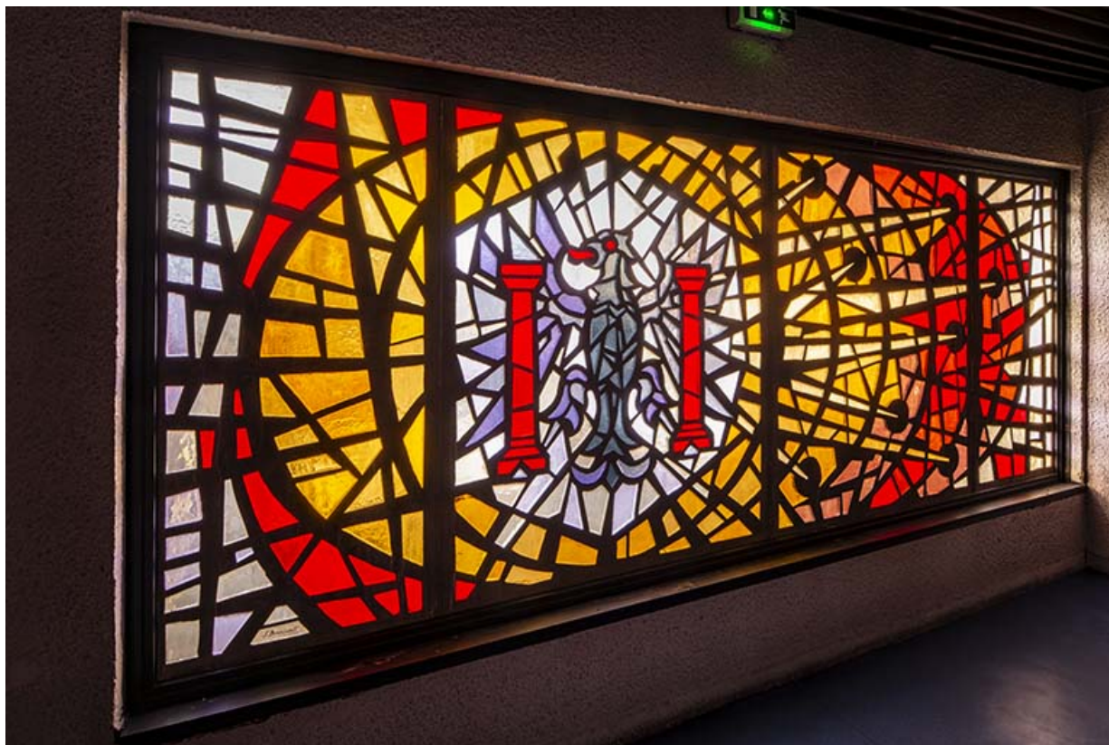
Vue d'ensemble, de trois quarts gauche.