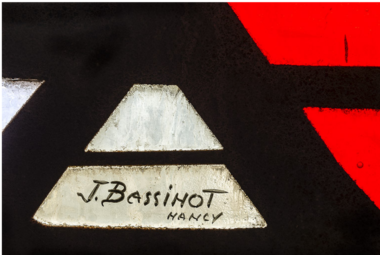
Détail : signature de J. Bassinot.