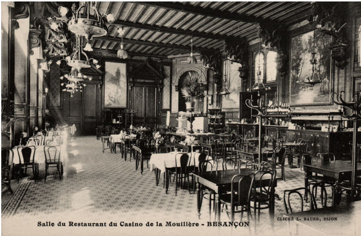
Salle du restaurant (vers 1900).