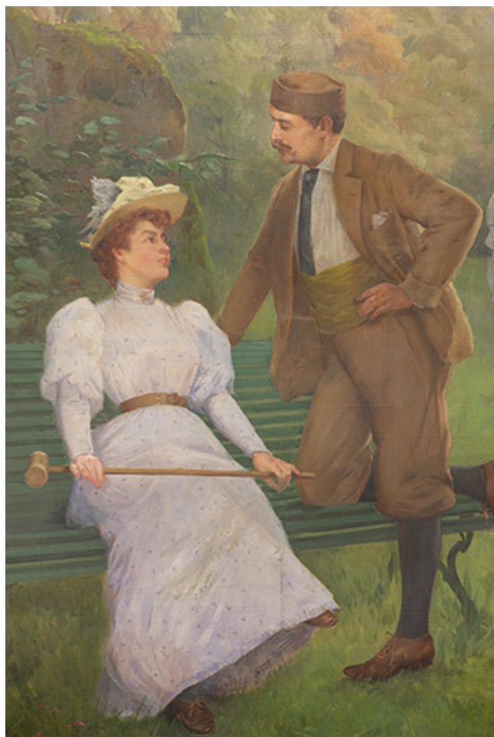
Détail, couple à gauche.