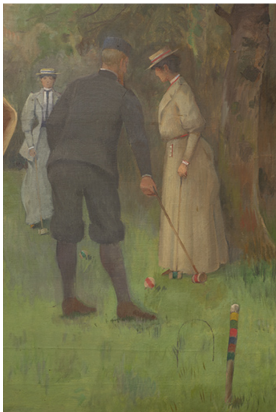
Détail, joueurs à droite.