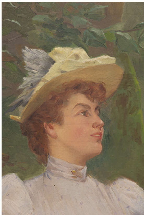
Détail, couple à gauche, femme.