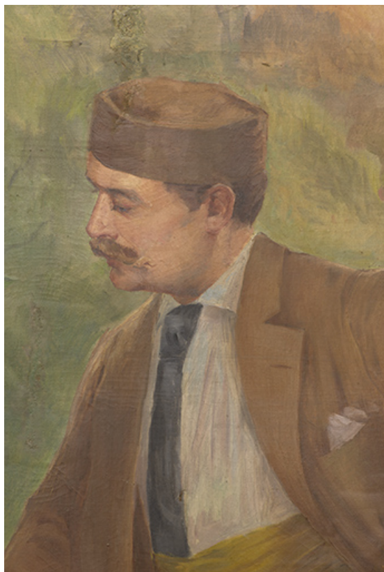
Détail, couple à gauche, homme.