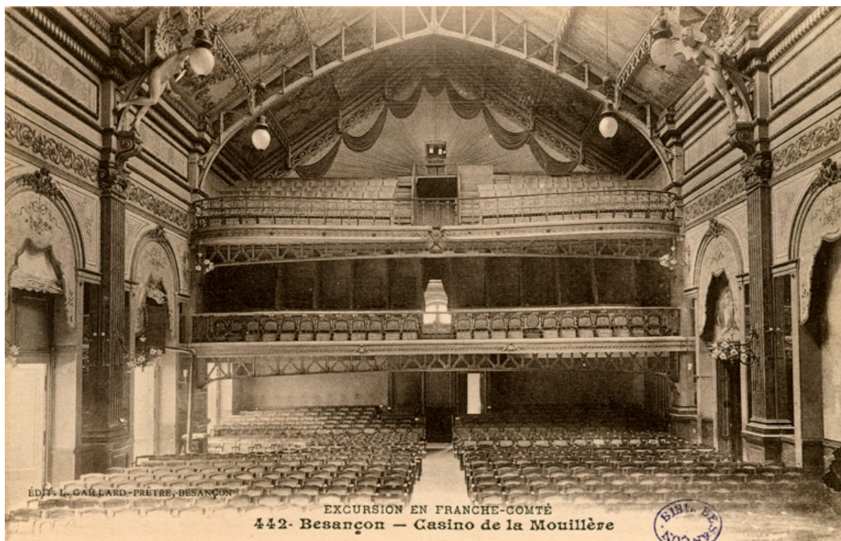
Salle (vers 1910).

25, Besançon, 1 esplanade Jean-Luc Lagarce