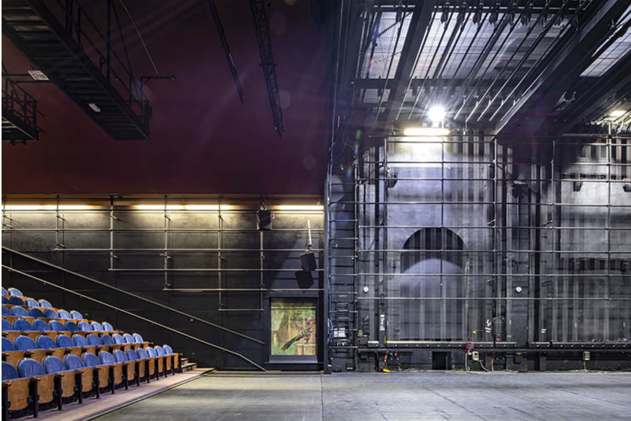
Vue actuelle de la salle en direction du mur nord-ouest (peinture au centre).

25, Besançon, 1 esplanade Jean-Luc Lagarce