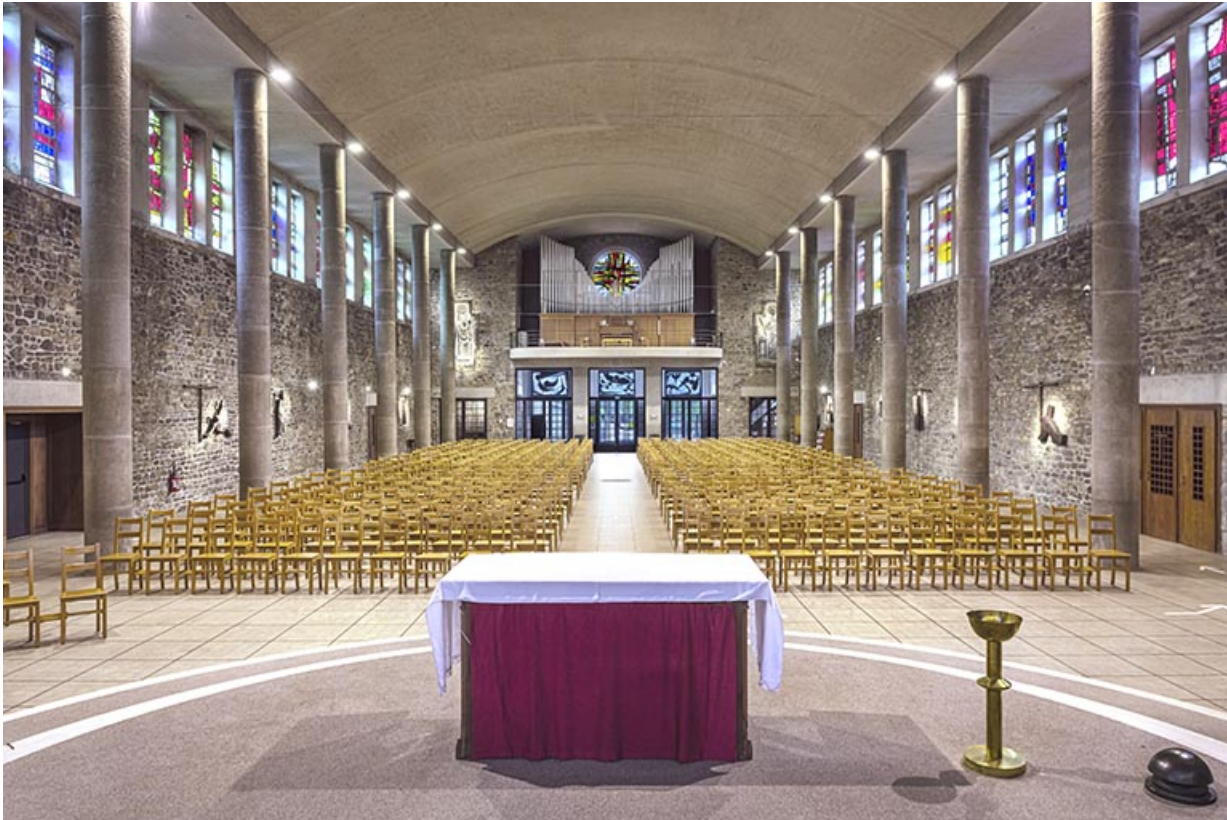
Chandelier de chœur, disposé à droite de l'autel.