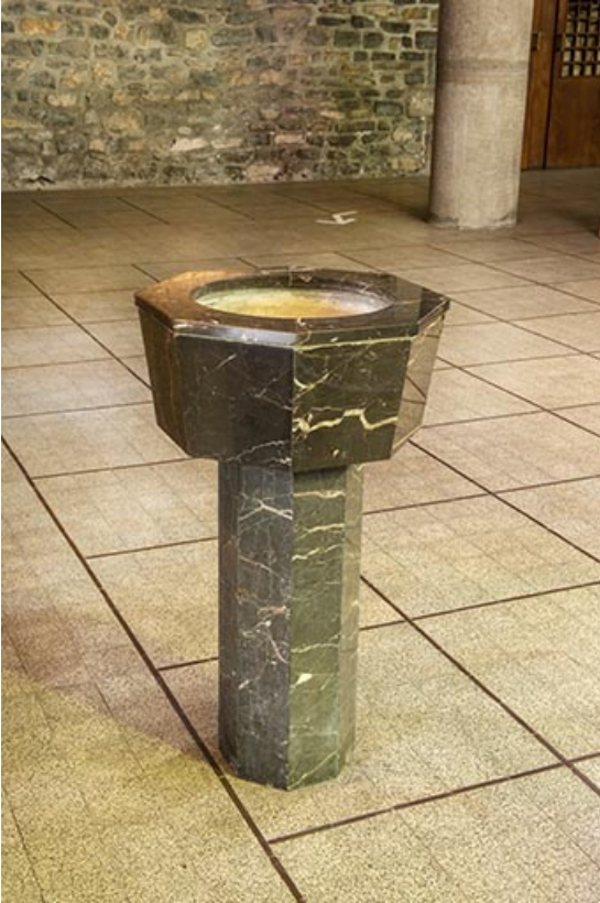
Vue d'un bénitier.