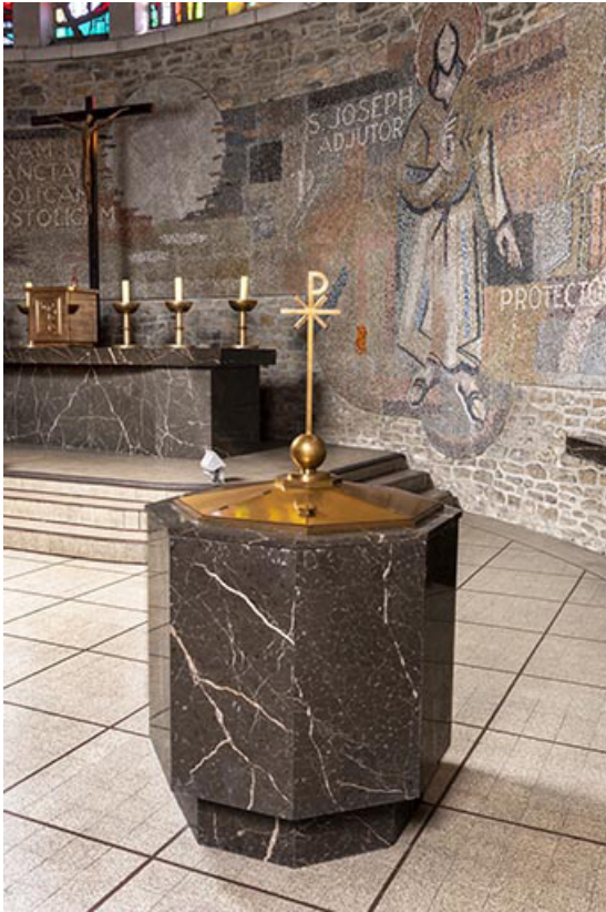
Vue d'ensemble des fontes baptismaux.