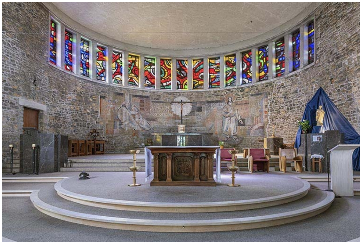
Vue du chœur.