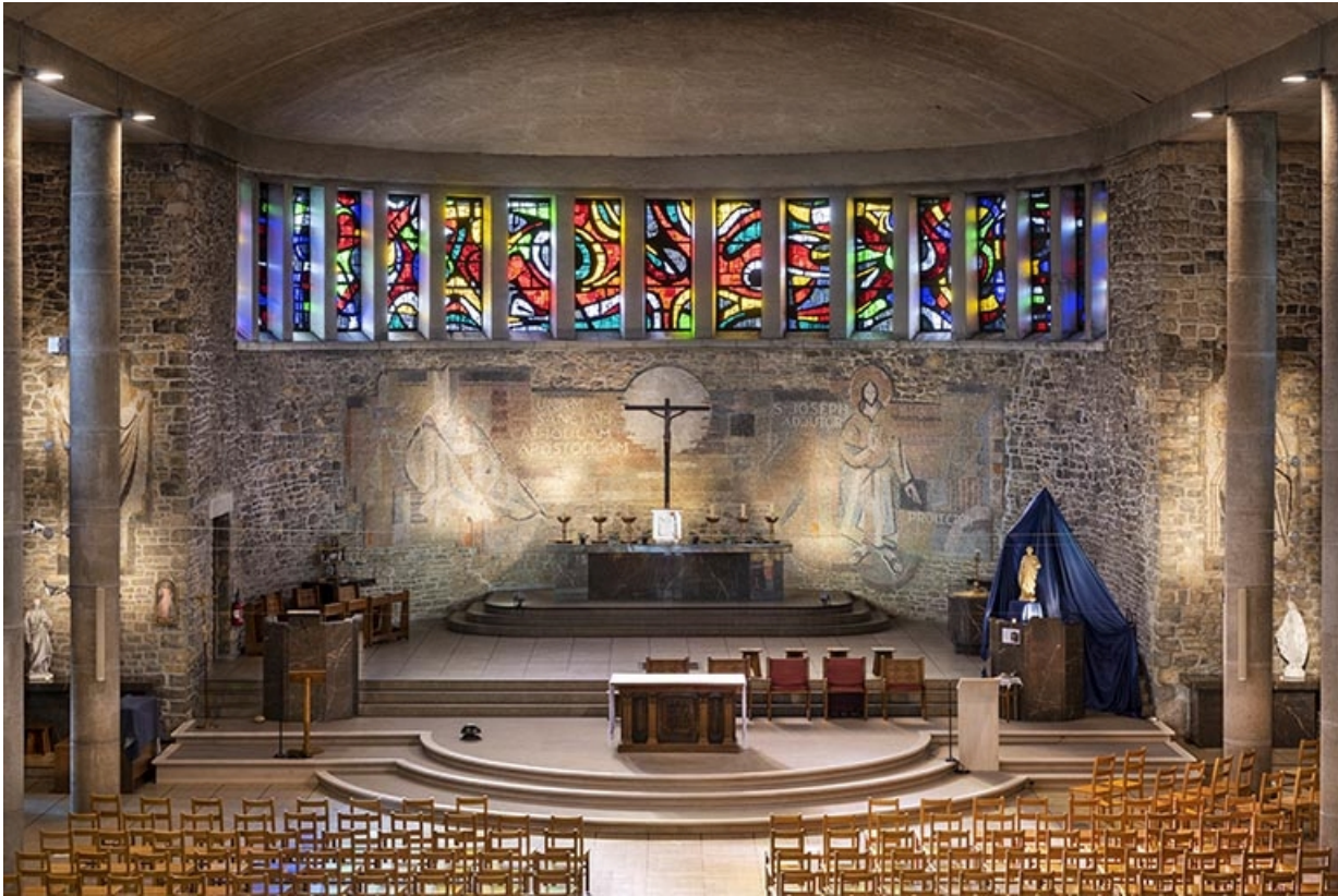
Vue d'ensemble du chœur.