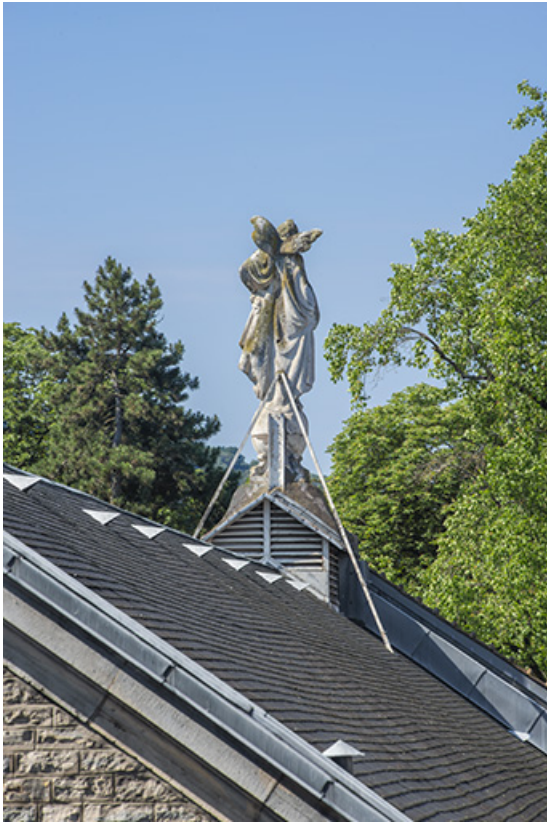
Vue de trois quarts, de dos.

25, Besançon, 1 esplanade Jean-Luc Lagarce