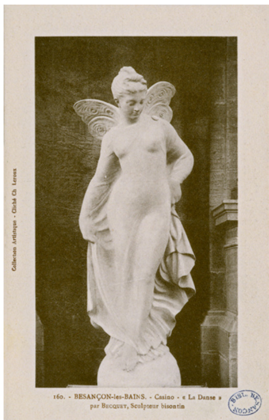
Photographie ancienne de la statue avant son installation (1892).

25, Besançon, 1 esplanade Jean-Luc Lagarce