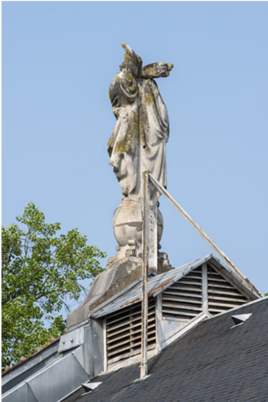
Vue de trois quarts, de dos.

25, Besançon, 1 esplanade Jean-Luc Lagarce