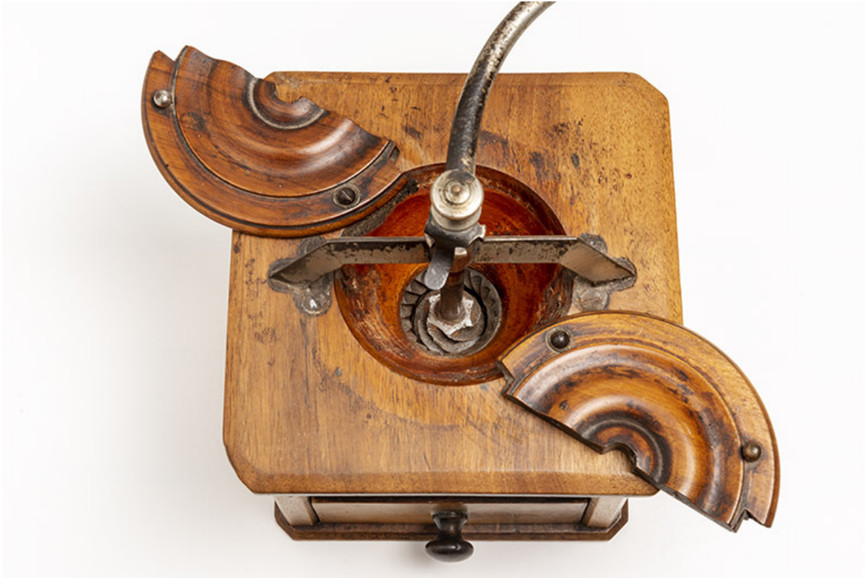
Moulin fabriqué à Valentigney. Vue plongeante.