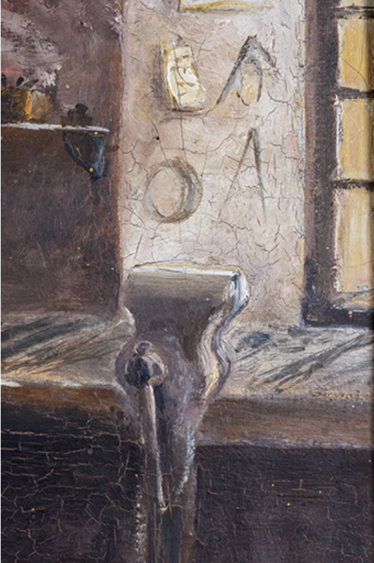
L'établi et l'étau à pied.

25, Montécheroux, 12 rue de la Pommeraie