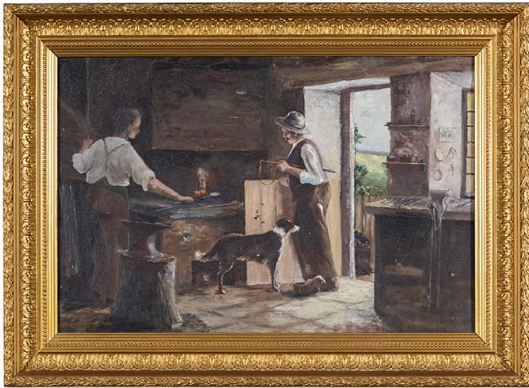
Atelier de fabrication : intérieur représenté sur le tableau d'Alfred Focht, de 1924. 25, Montécheroux, 12 rue de la Pommeraie