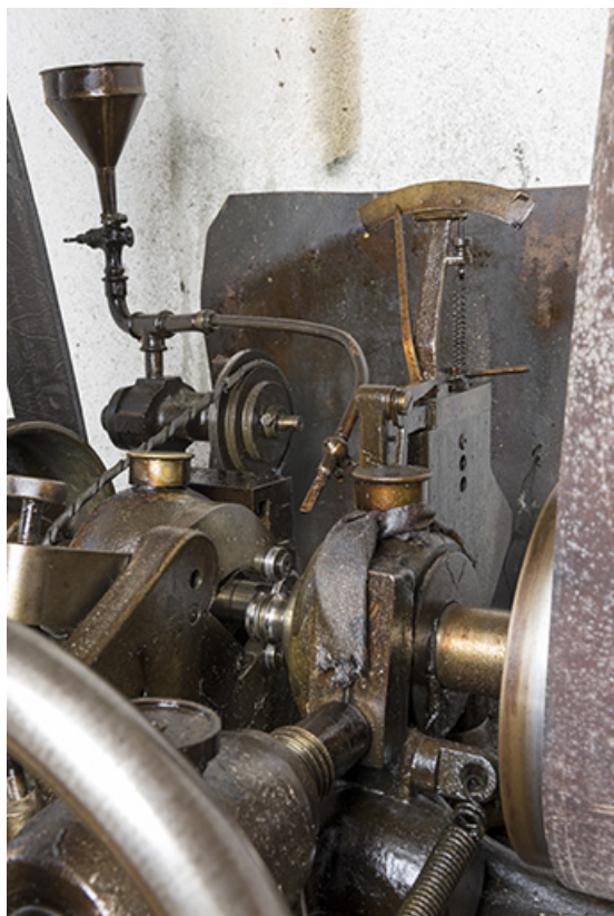
Partie travaillante (sous le tuyau d'amenée d'huile). 25, Charmauvillers, 23 Grande Rue