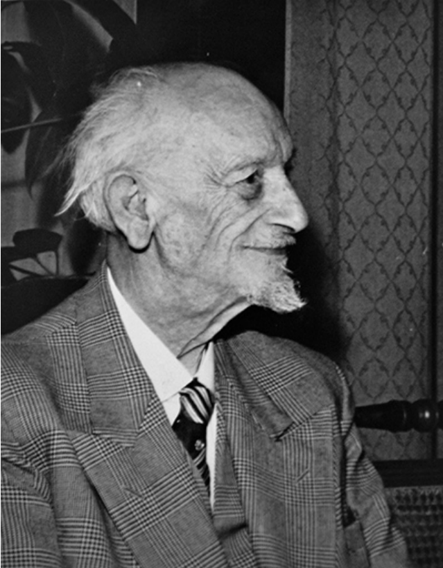
[Portrait de Louis Bréguet (1877-1962)], 1957. 25, Charmauvillers, 23 Grande Rue