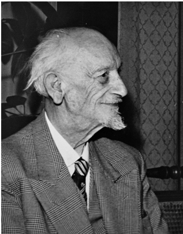
[Portrait de Louis Bréguet (1877-1962)], 1957. 25, Charmauvillers, 23 Grande Rue