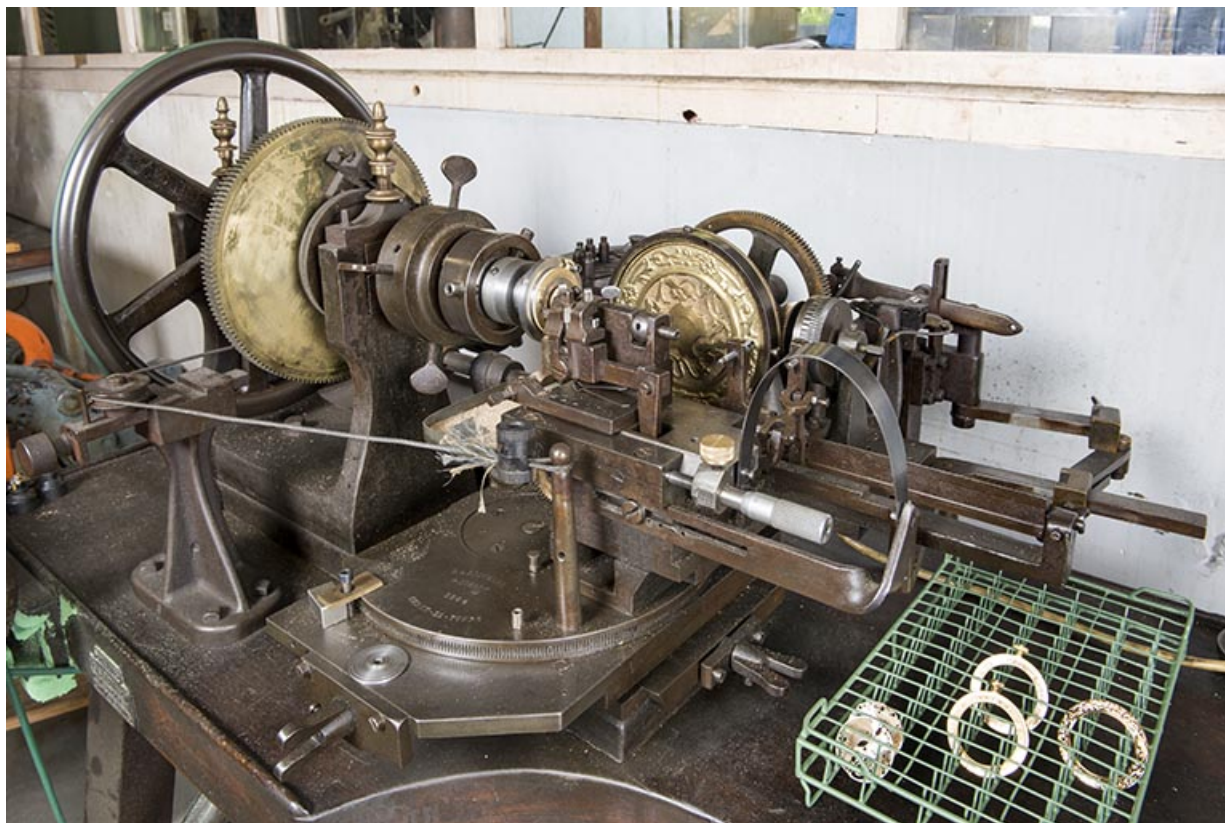
Machine à graver (machine à guillocher), par Lienhard à La Chaux-de-Fonds, 1904. 25, Charmauvillers, 23 Grande Rue