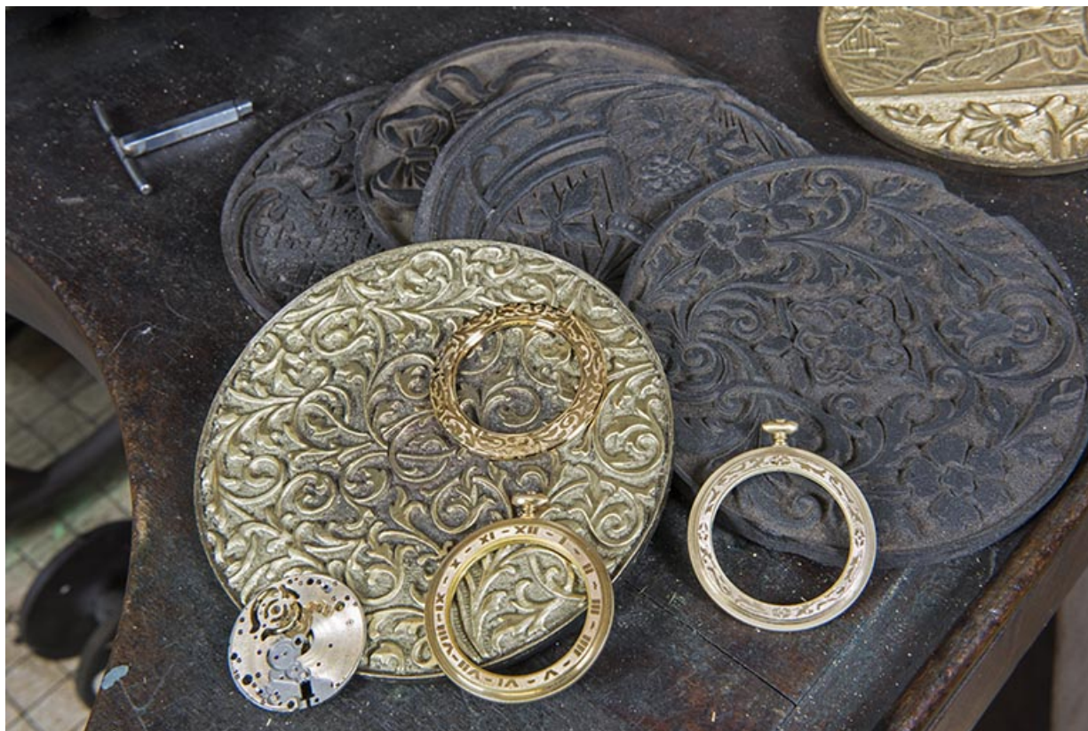
Modèles et lunettes de boîtes de montre de gousset. A gauche, une platine de montre guillochée. 25, Charmauvillers, 23 Grande Rue