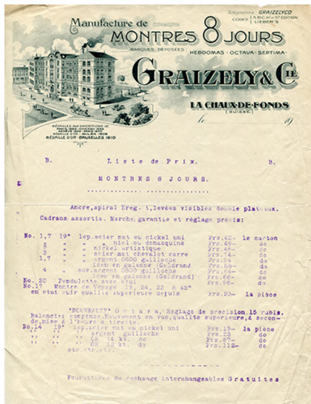
Papier à en-tête de la société Graizely & Cie, entre 1906 et 1914. 25, Villers-le-Lac, 4 place Saint-Jean