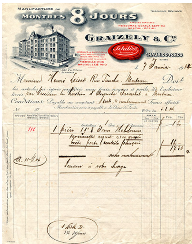
Papier à en-tête de la société Graizely & Cie, Schild & Co successeurs, 7 janvier 1914. 25, Villers-le-Lac, 4 place Saint-Jean