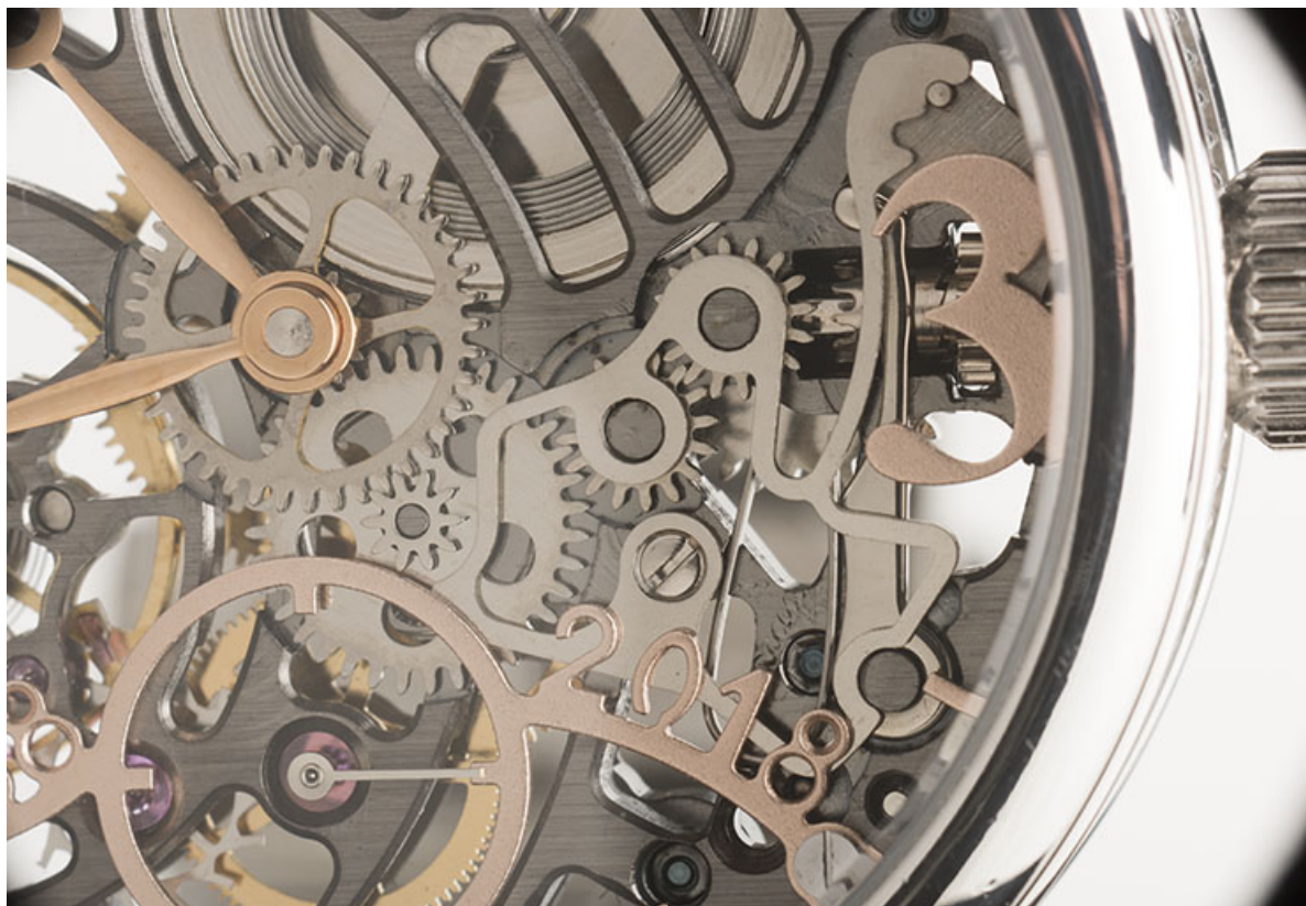
Cadran : cadran des secondes et tirette.