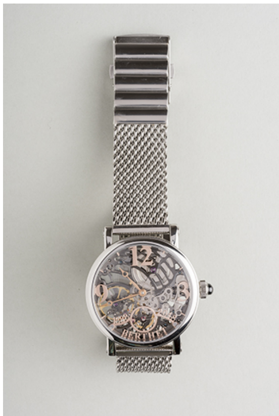
Vue d'ensemble frontale.