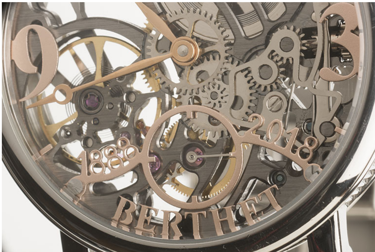
Cadran : inscriptions et cadran des secondes.