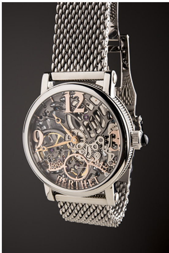
Montre-bracelet mécanique de la société Berthet Horlogerie, à Villers-le-Lac. 25, Villers-le-Lac, 4 place Saint-Jean