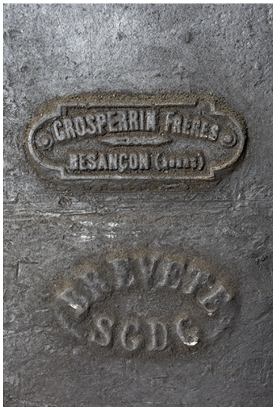
Plaque du constructeur (Gersperrin Frères).